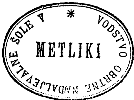
Žig obrtonadaljevalne šole v Metliki iz leta 1901

odhodnim spričevalom tukajšnje obrtne nadaljevalnice /.../, ter da se določi jednega izmed tukajšnjih učiteljev za izpraševalca teoretičnih predmetov pri vajeniških izpitih za pomagače.« 8 Posredovati je moralo celo okrajno glavarstvo v Črnomlju, ki je marca 1914 izdalo odlok »v zadevi posejanja obrtno nadaljevalne šole v Metliki in izdaji učnih spričeval oz. pomagalskih pisem,« v katerem je prizadetim jasno razložilo obrtno zakonodajo glede teh vprašanj. 9