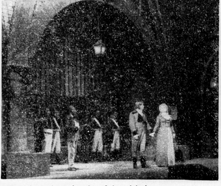
André Chemier, prizor iz zadnjega dejanja