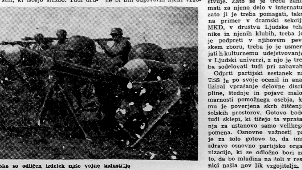
Protitankovske puške naše vojske so odličan izdelek naše vojne industrije

strednjih šolah pa 4,6%. Ta odstotek je enak pri delavcih kakor pri nameščencih in je večji tam, kjer je zaposlen le eden izmed staršev.