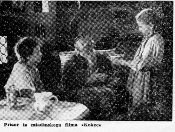
Prizor iz mladinskega filma »Kekec«