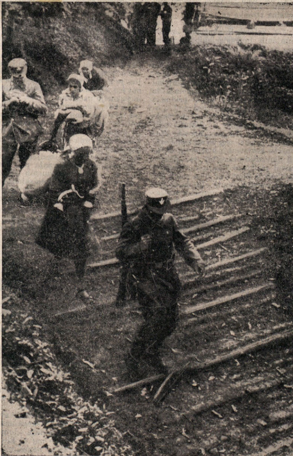
Ta zločin se nikdar več ne sme ponoviti!