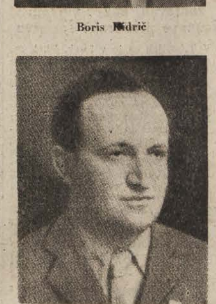
Dr. Vladimir Bakarić