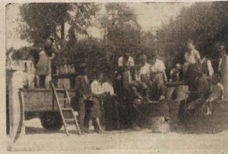
Kleparji so popravljali kuhinjsko posodo, žene pa so razkladale steklo