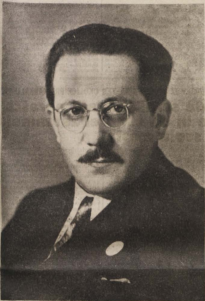
EDVARD KARDELJ — VODJA DELEGACIJE

MNOŽICE VSEPOVSOD OB PROGI POZDRAVLJAJO DELEGACIJO — V SLOVENIJI JE ZADNJE DNI NAD 500.000 UDELEŽENCEV NA MNOŽIČNIH ZBOROVANJIH ZAHTEVALO PRAVIČNE MEJE IN IZRAŽALO VSE ZAUPANJE NAŠI DELEGACIJI