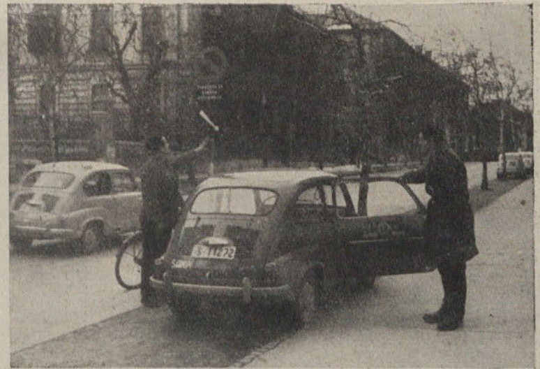
Pri praktični vožnji se morajo kandidati seznaniti tudi z vsemi prometnimi znaki

Tudi izpiti mopedistov pri društvu potekajo zadovoljivo, saj je od začetka — to je od 16. 1. 1961 pa do vključno 13. 9. 1961 404 kandidatov-mopedistov uspešno opravilo izpit. Avto-moto društvo Moste je pri izpiti za mopediste