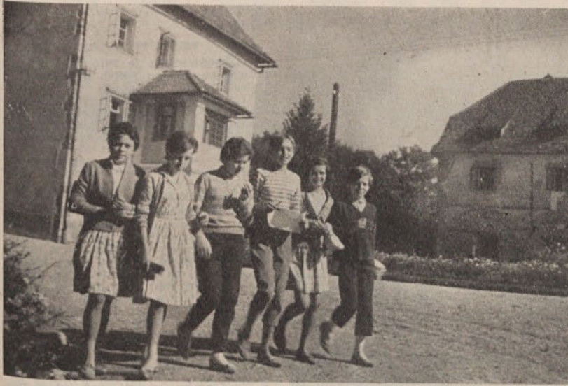
Na sliki vidimo udeležence množičnega teka ob spomenikih revolucije