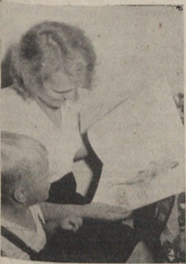
Šivalni servis je dobro obiskan

Stanovanjskim skupnostim pa priporočamo, da na raznih vidnih mestih v območju svojega delovanja izobesijo table z napisi, kje je skupnost in kje so posamezni servisi. Tako bodo vsi zainteresirani dobro obveščeni in odpadla bo šele nepotrebna pomanjkljivost.