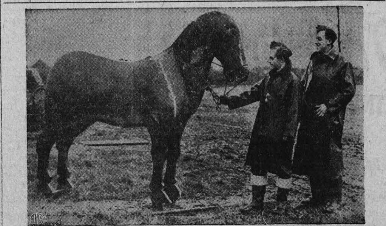
Da bi premotili zavezniške letalce, so Nemci na svojih letališčih postavili velikanske lesene konje, da bi tako naši letalci mislili, da so nad kakšnim pašnikom in ne nad nemškim letališčem. Na sliki vidimo dva zavezniška letalca, ki s zanimanjem ogledujeta nemško igračo.