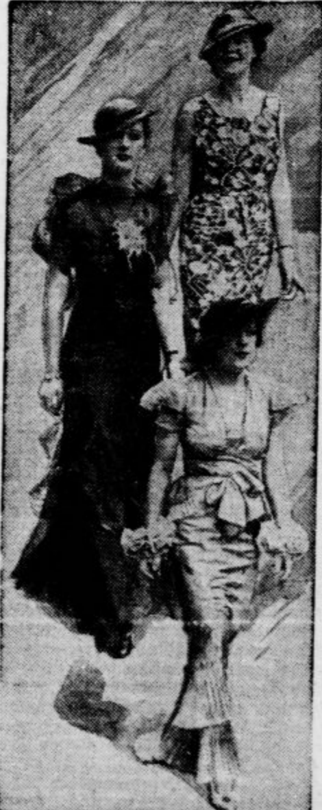
Moda, kakršna je bila pred dvajsetimi leti, postaja zopet moderna

Čitajte tedensko revijo „ŽIVLJENJE IN SVET“