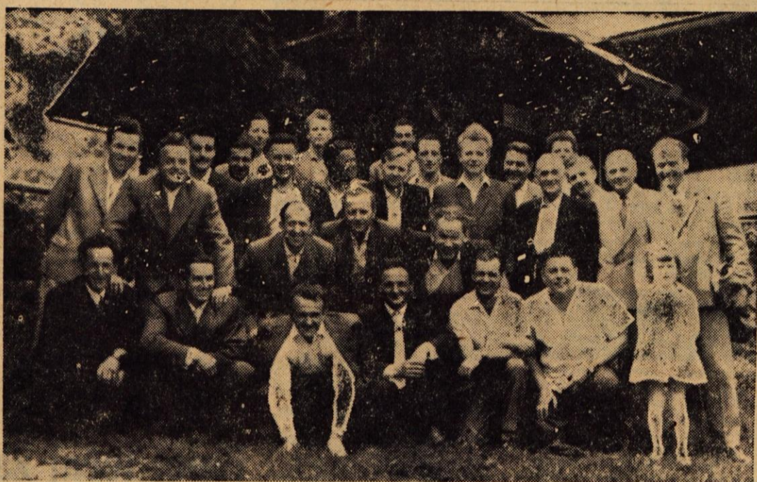
Dupeljski pevci na izletu v Velenju

Ob 35-letnici moškega pevskega zbora v Dupljah