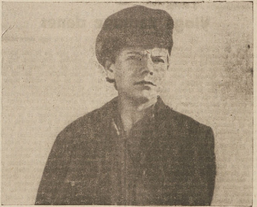
Mladost Maksima Gorkega.

Znan film je »Lenin oktobra 1918.«, ki prikazuje nesmrtnega voditelja boljševikov v dobi ko se je sovjetska oblast utrjevala. Film prikazuje vso veličino genialnega Lenina, ki je vodil nekdanji prebrazpne ljudske množice v zmagoslavni pohod proti izkoriščevalcem. V filmu »Mi iz Kronštata« se pa prikazuje brezmejnja požrtvovalnost in globoka moralna zavest rdečih mornarjev, ki se tožejo z belogardisti v okolici Petrograda, ki se tožejo do poslednjega diha in umirajo za velike ideje, ki jih je kot gesla nosila velika oktobrška revolucija in ki kot taka pomeni narodom Sovjetske zveze prebujenje in preorenje v svet enakopravnosti, svobode,