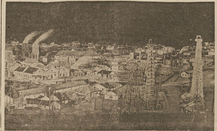
Romunski pe trolejski vrelci

S tem očitkom skuša kriti druge stvari, ki jih najdemo v upih Anglije, katera se je nadejala, da bo osvoboditev balkanskih držav pripravila pot za vzpostavitev »normalne« mirnodobske trgo-