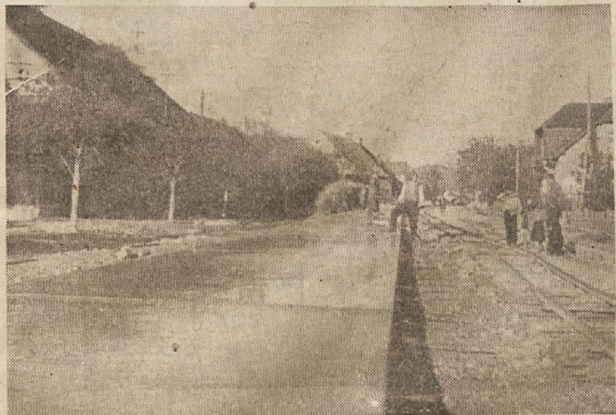
Tako gradimo moderno betonsko cesto Ljubljana—Vrhnika

Uspehi obnove in izgradnje se kažejo prav povsod. Obnovljen promet, tovarne, rudniki, industrija, podjetja, vse dela v novem tempu, povsod vlada tekmovalni duh, povsod se dosegajo vedno večji in večji uspehi. To pa iz prav enostavnega razloga, ker je delovnemu človeku postalo jasno, da vse, kar danes doprinese, je namenjeno bodočnosti, katere je vsa, prav vsa naša.