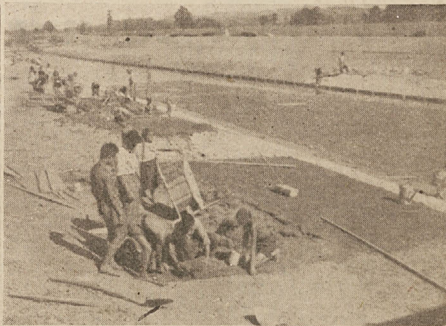
Pesnico regulirajo. Vsa dela je izvršila izključno mladina

si za mesec julij priborili proletarsko prehodno zastavo. Tako so si s požrtovalnim delom priborili še naslov najboljšega delovnega kolektiva Slovenije. Jeklarna je dosegla največjo proizvodnjo in je tudi največ pripravila na materialu. Drugi oddelki spet prednjačijo po največjem številu udarniških ur, po najboljši oceni v delovni disciplini. Delavci so vsi organizirani v Enotnih sindikatih in se pridno udeležujejo na prosvetnem in na fizikalnem polju. Omeniti je treba, da jeseniški kovinarji poleg svojega naporega dela v železarni žrtvujejo mesečno 450.000 din za gospodarsko in socialno obnovo okraja. Uspeh jeseniških kovinarjev je za nas tem pomembnejši, ker je njihovo delo ena najosnovnejših industrijskih panog za uspešno obnovo naše skupne države Jugoslavije. Pomen njihovega uspeha pa ni samo v tem, da so dvignili proizvodnjo, ampak tudi v tem, da so bkrati dali zgled ostalim tovaršem po Sloveniji in tako prispevali k splošnemu dvigu delovnega poleta.