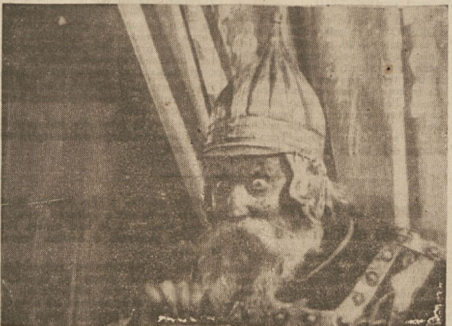
Igralec Potemkin v vlogi »Generala« v sovjetski filmski pravljici: »Na ščukino zapoved«.

Kdor koli bo prišel v eno izmed teh vasi, bo opazil nekaj novega, zdravega in lepega. Razširjena okna, prava razporeditev notranjih prostorov, dajejo novo notranje in zunanje lice istrskim vasem. Ogarev.