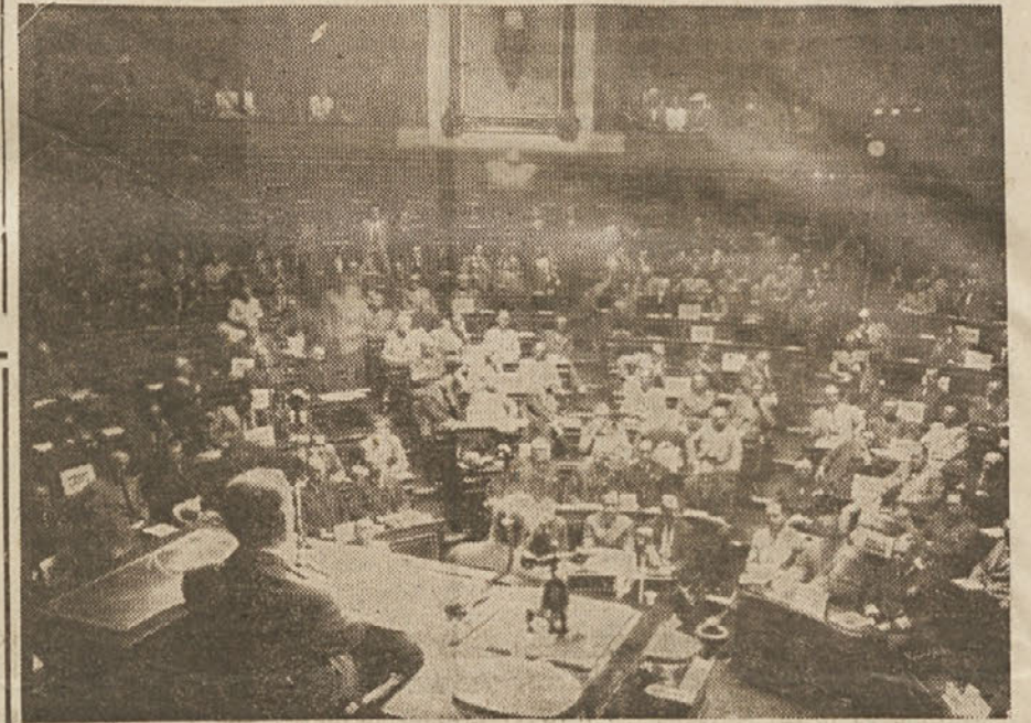
Prizora z zasedanja Združenih narodov: Pogled na plenarno zasedanje 21 držav, zmagovalk v protifašistični vojni.

Razprave in sklepi na mirovni konferenci v Parizu in v organizaciji Združenih narodov so le dokaz, da boj za zmago demokracije ni še končan. Fašizem je bil pobit na bojnem polju. Toda razlogi, ki so dali fašizmu življenje, so še vedno tu in delujejo dalje. Vse to nam priča, da morajo ostati demokratični narodi budno na straži, da se ne smejo zadovoljiti z doseženimi uspehi, da se ne smejo boriti le proti ostankom fašizma, marveč da morajo tudi uniče-