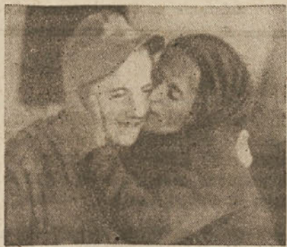
Albanski partizan se je vrnil k svoji materi

Svojo zahtevo po južni Albaniji utemeljujejo monarhofašisti s tem da je