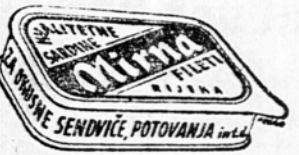
»SANTINI« SENČIČE, POTOVANJA

Če si se preselil iz ene voline enote v drugo, poskrbi pravočasno, da boš v kraju sedanjega bivališča vpisan v volilni imenik. (Jugopres)