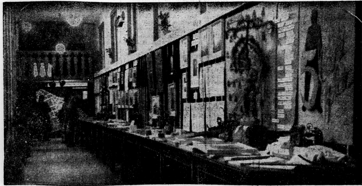
Z razstave ob 30 letnici ljubljanske univerze v Narodni in univerzitetni knjižnici