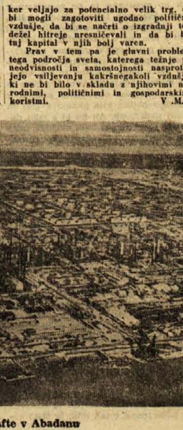
Refinerija nafte v Abadanu

znatno razširiti svoje pozicije, in sicer ne samo v škodo Velike Britanije, marveč tudi ZDA, ki so za zdaj še drugi pomembni trgovinski činitelj teh dežel.