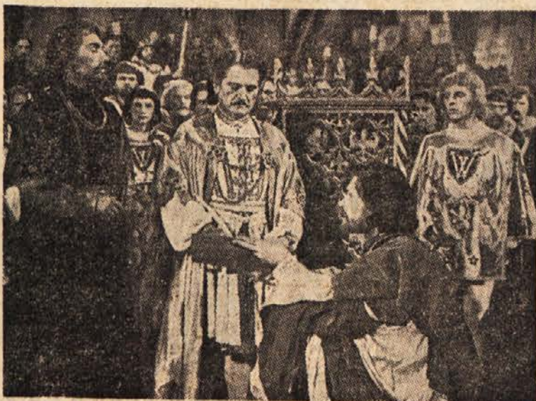
Prizor iz filma režiserja Václava Kršky »Dalibor«, ki ga bo posnel po istoimenski Smetanovi operi.

sнемalo na celuloidni trak že kar 5 samostojnih filmskih podjetij. Ko je prva leta po vojni začel Hollywood svoj boj za trg, je večina nacionalnih kinematografij propadla. Tudi češka je komaj životarlila vse tja do zadnjih let nemega filma, ko je češkim filmskim delavcem uspelo najti lastni stil in jezik, s katerim so nato v naslednjih letih želi obilo uspeha tudi v tujini. Trideseta leta so prinesla domačemu filmu največja imena (Vavra, Rovensky, Stallih in Roth), od katerih nekateri še danes predstavljajo glavne stebre sedme umetnosti na Češkem.