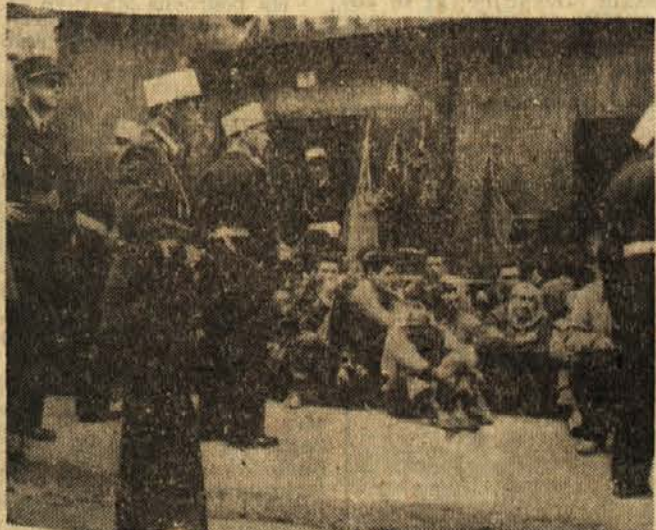
Racije v Constantini v Alžiru

V vseh glavnih krogih so ugodno sprejeli javno podporo starega radikalnega voditelja Herriota, če zlasti zato, ker niti vsi člani vlade niso enakih misli o načinih in vrstnem redu ukrepov, ki so potrebni v Alžiru.