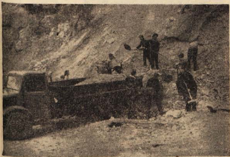
Takole je trboveljska mladina začela proslavljati desetletnico mladinskih delovnih brigad: gimnazijci so ves dan neutrudno nakladali v občinskem kamnolomu gramoz