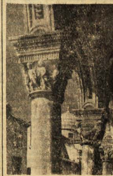
Stebrovje dubrovniškega knežjega dvorca, v katerem zaseda Svet Medparlamentarne unije

da bi ga uredili na letošnji konferenci Medparlamentarne unije, ki bo sredi novembra v Bangkoku. Zato so sklenili imenovati