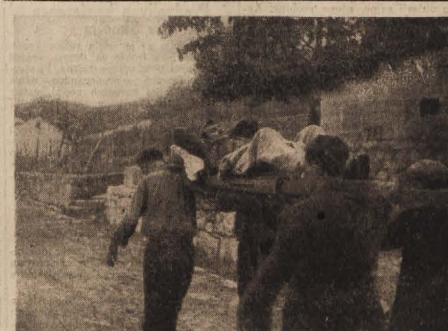
Ko še ni bilo prevoznih sredstev, so prenašali naši borci svoje ranjene tovariše na ramah po več dni daleč v gozdove, kjer so bile partizanske bolnice.