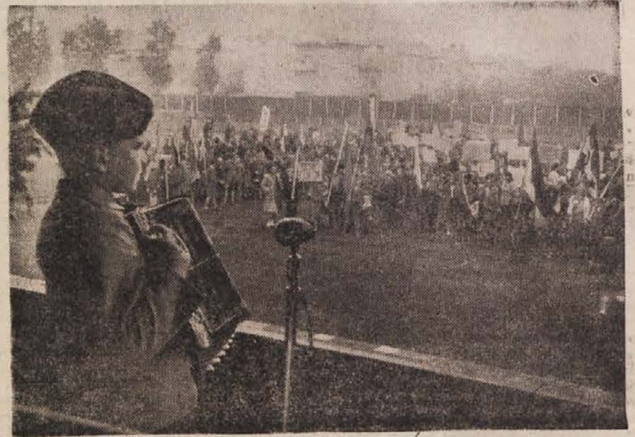
Pionirji iz vse Ljubljane so se zbrali na igrišču Primorja