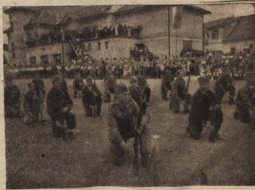
Zleta se je udeležilo ljudstvo iz daljne in bližnje okolice, prišla so odposlanstva iz vseh krajev Stajerske, iz Ljubljane in tudi iz Koroške. Na tej veliki manifestaciji moči in edinstva slovenskega naroda je govoril minister za zdravstvo Narodne vlade Slovenije dr. Abtin.