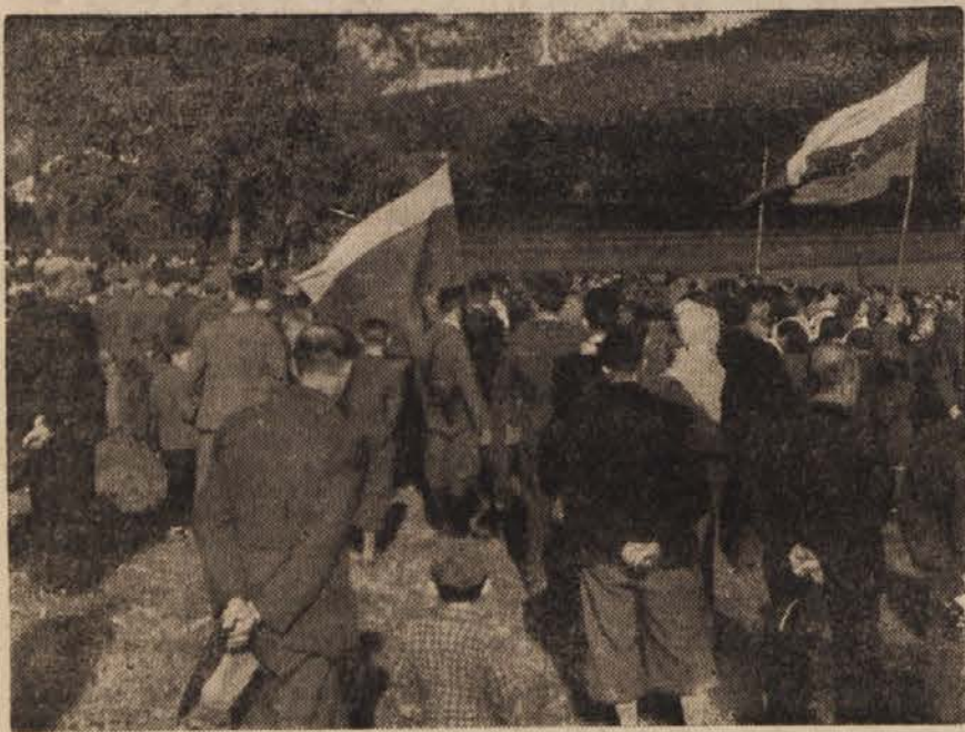
Sredi njiv in vrtov Kovorskega polja, kjer so bili 18. januarja 1944 ustreljeni talci-Ljubljančani, se je 30. septembra 1945 vršila žalna komemoracija.