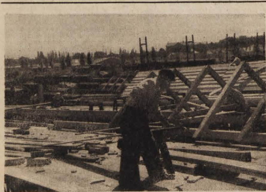
V mariborskih železniških delavnicah. Tretjina porušenega vozovnega oddelka je že pod streho