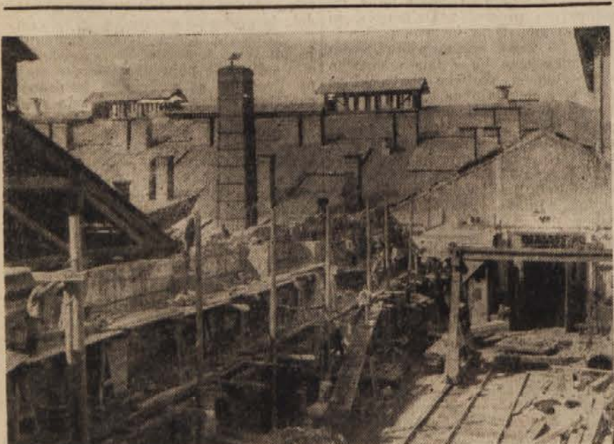
Mariborski železničarji sami obnavljajo porušene delavnice