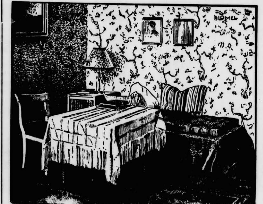
Sie im Zimmer eines jungen Mädchens. (Architekt Heinrich Tessenow.)

nen Gegenstand begeistert verteidigen, den wir noch vor kurzem entschieden abgelehnt haben. Wir sehen es ja täglich an der Mode der Frauen, wie wandelbar geschmackliche