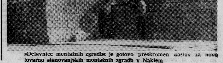
»Delavnice montažnih zgradb je gotovo preskromen naslov za novo tovarno stanovanjskih montažnih zgradb v Naklem