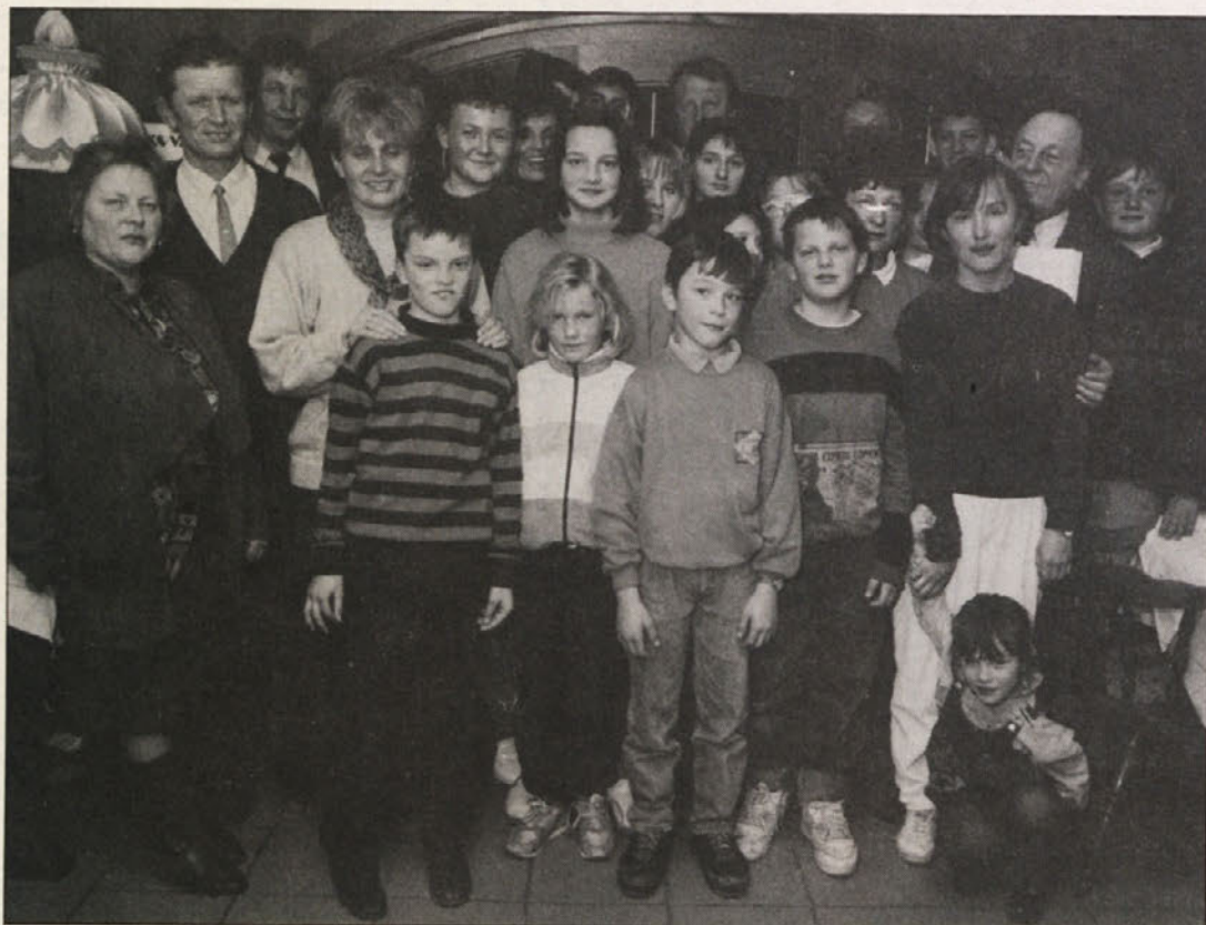
Veseli otroci in njihovi spremljevalci v krogu gostiteljev.

Na tej svečanosti bo slavnostni govor in kulturni program. Udeležili se je bodo tudi gostje iz Slovenije. K udeležbi vabimo tudi vse koroške demokrate in antifasiste. Pripeljite s seboj tudi svoje sorodnike in znanke, da bo spomin na padle še bolj svečan.