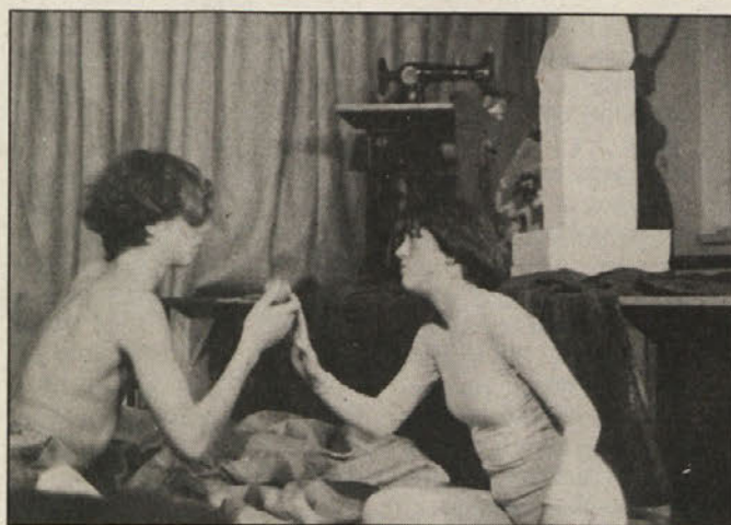
Prizor z vaj za uprizoritev

obnovili gledališko dejavnost, Na uprizoritev so se zavzeto pripravljali vse od jeseni, ker je zahtevna tako po igralski kot tehnični plati. Žal je Tišlerjeva dvorana za vse ljubitelje šentjanskega gledališča premajhna, zato bodo predstavo ponovili. Priporočamo nakup vstopnic v predprodaji, dobite jih pri društvenikih. Več na 5. strani ..