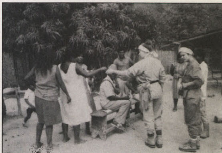
Samantha in Sonja delita darila poglavarju in ženam.