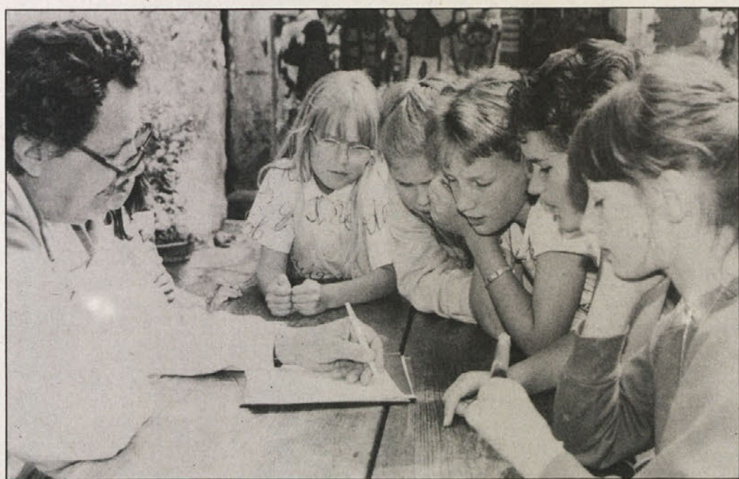
Rad se je ukvarjal z našo mladino.