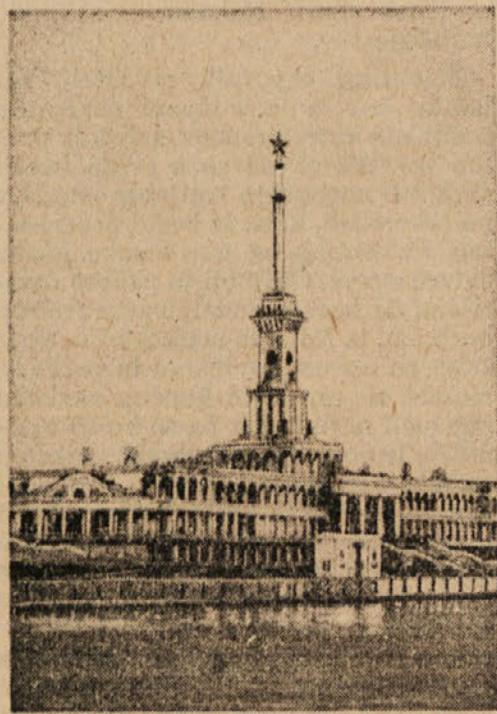
Pristanišče Chimka pri Moskvi

4. septembra 1943 je generalisim J. V. Stalin sprejel poglavarje ruske pravoslavne cerkve metropolite Sergeja,