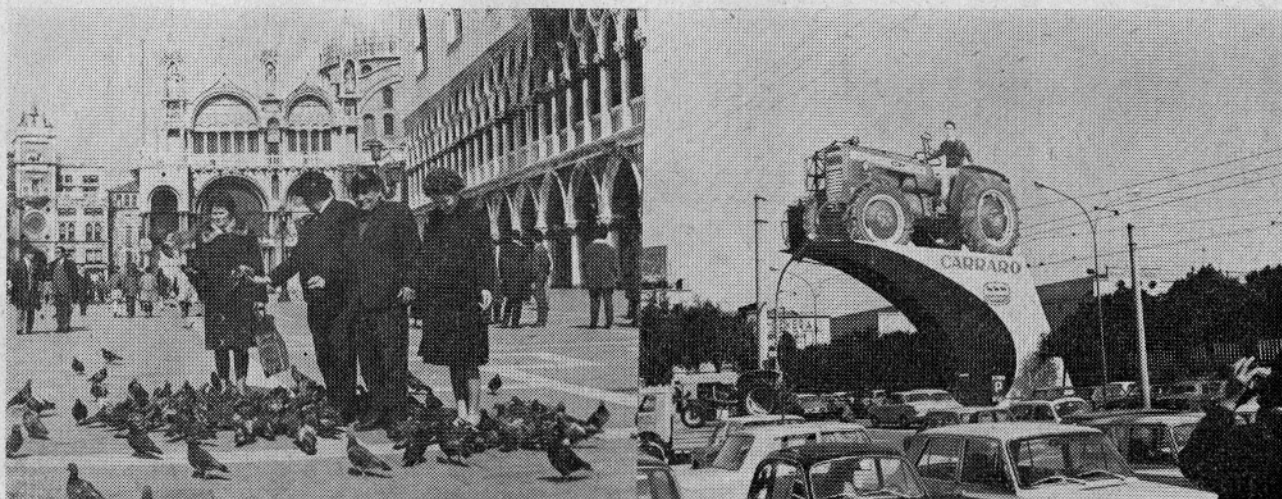
Udeleženci izleta na Markovem trgu v Benetkah in razstavní prostor v Veroni