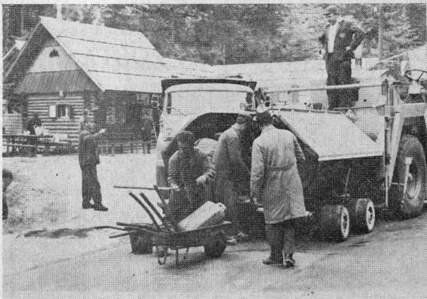
Asfaltni trak se je približal Logarski dolini. Cesta je že asfaltirana do Igle

Na Rečici ob Savinji so volivci opozorili na problem neustreznih šolskih prostorov. Po programu razvoja šolstva je za gradnjo nove šole v Mozirju na vrsti šola na Rečici ob Savinji. Bojijo se, da program ne bo uresničen. Volivci so se tudi zavzeli za cestno povezavo Rečica ob Savinji—Žekovec, ki bi bila za gradnjo turističnega centra Golte za njihov