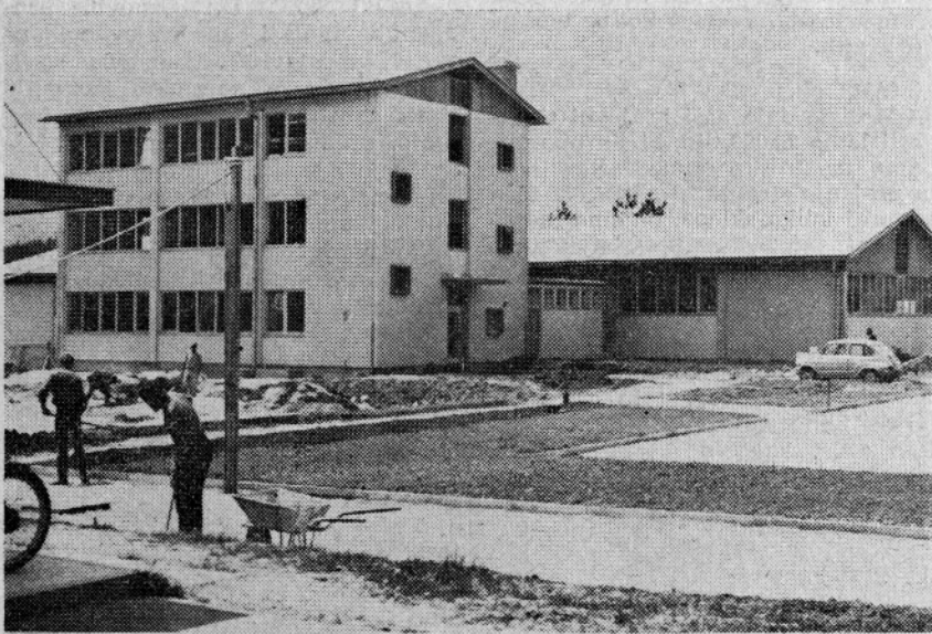
Pri novi tovarni so v teku zadnja dela

vodni hali neprimerno boljši kot so bi do sedaj. Prostornost, svetloba in zračnost bodo v veliki meri vplivali na dobro počutje proizvajalca. Vgrajene bodo tudi naprave za predvajanje glasbe v času odmora.