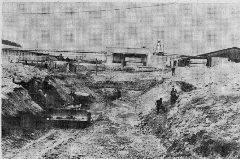
Zemeljska dela za tovarno ivernih plošč se že izvajajo

veda treba zagotoviti dovoljno število sposobnega strokovnega in vodstvenega kadra, za kar pa je že poskrbljeno. Prav v teh dneh je odšla na tritedensko prakso skupina 15 ljudi v Vinkovce, kjer že obratuje