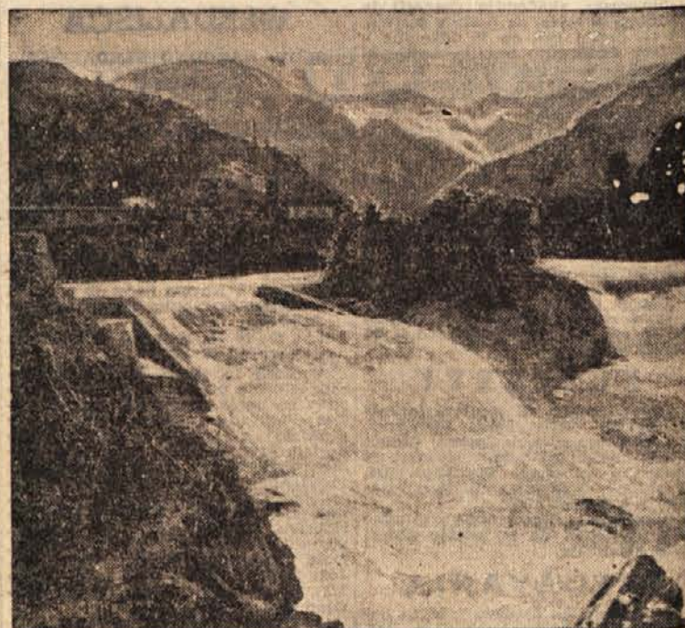
Pogled na Pireneje

Raziskovanja jam je razmeroma še mlada znanost. Zemlja pa krije v svojih neдрjih še mnoge skrivnosti. Mednje še zmeraj sodi tudi natanka ugotovitev časa, kdaj so živeli ljudje, ki so dosegli tako visoko umetniško stopnjo. Geologi domnevajo, da so živeli med 60.000 in 10.000 leti pred našim štetjem. Pri tem ima tudi atomska znanost odločilno besedo. Atomske fiziki namreč lahko ugotove dobo razpadanja raznih mrtvih snovi in njihovo starost. Skoraj na vseh jamskih slikah pa nahajamo kostni pepel, torej snov, v kateri so radioaktivni delci. Arheologi čikaške univerze so na podlagi kostnega pepela, izvirajočega iz slik v jami pri Lascauxu z geigerskim števcem ugotovili, da so te slike stare kakih 15.500 let.