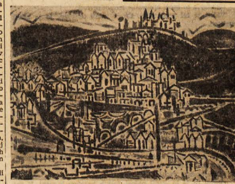
Antreasian Garo Z.: Rivertown No 2