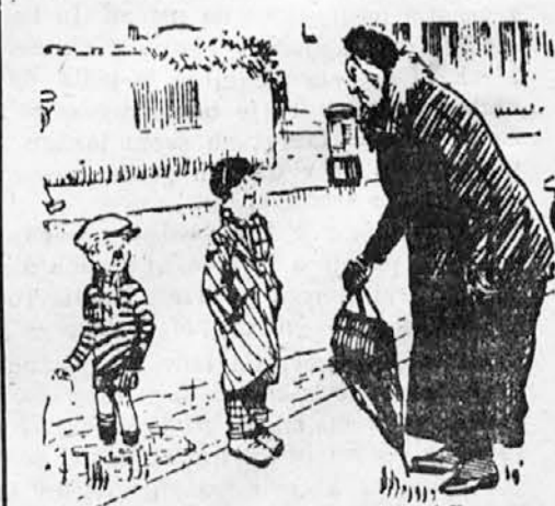
»Tvoj bratec se bo prehladil, če bo tako dolgo stal v vodi.« »Nič ne dé — saj ima že nahod.«

Finančno ministrstvo Zedinjenih držav je izdalo statistiko o osebni dohodnini svojih davkoplačevalcev. Po tej statistiki živi v Zedinjenih državah 511 oseb, ki imajo po 1 milijon dolarjev ali 56 milijonov dinarjev letnega dohodka, 26 oseb pa ima po 5 milijonov dolarjev na leto. Med osebami, ki imajo milijonske letne dohodke, je tudi 28 žensk. Na drugi strani pa ne smemo pozabiti, da živi v Zedinjenih državah poleg bogatih milijonarjev tudi nekaj milijonov ljudi, ki ne plačujejo nobenega davka, ker ga nimajo s čim.