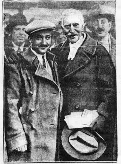
Major Franco v Belgiji

Sodišče je dalo prav podjetniku in ne dajala lačni materam in je podjetnika opravičilo.