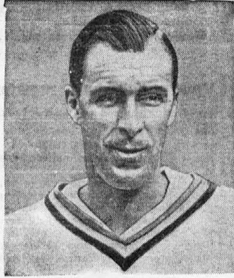
»Big Bill« Tilden

Tako nam je preteklo leto prinašalo rekord za rekordom. Doseglo pa je še en rekord, ki stoji nad vsemi drugimi rekordi: rekord človeške neumnosti.