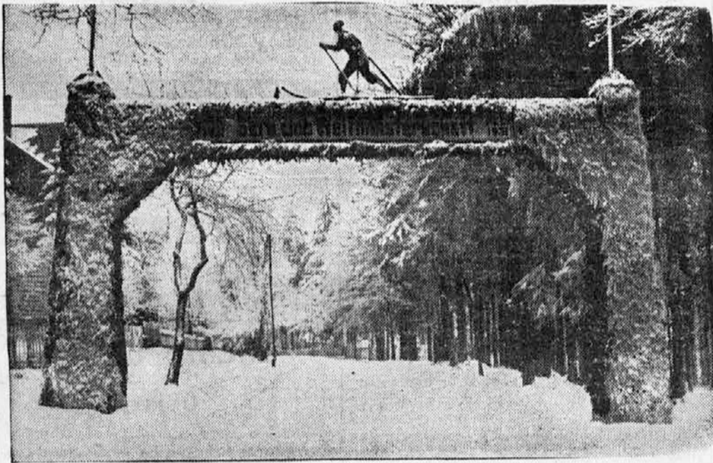
Mednarodne tekme za mojstrstvo v smučanju v Oberhofu