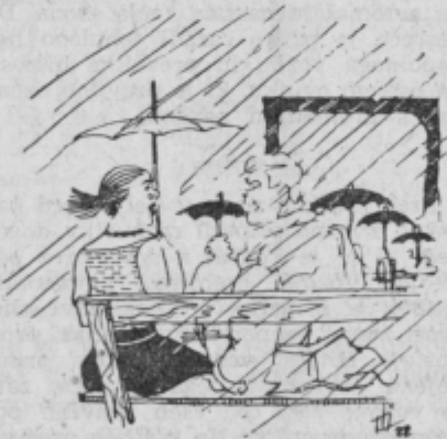
Zakaj pa hodite v Letni kino, če nimate dežnika?