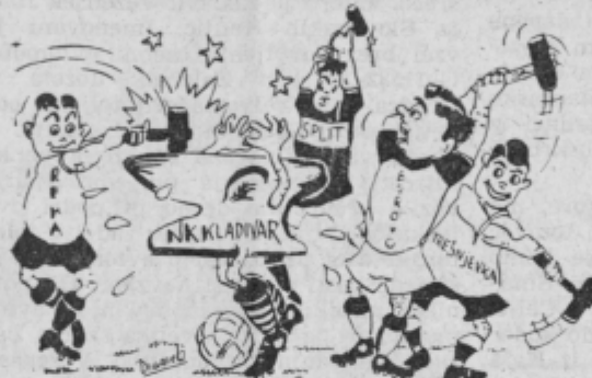
Zgovorni komentar brez komentarja