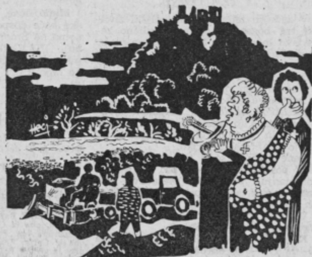
Saj vam pravim gospa, da tile hostarji niso nič prida, samo razkopavajo