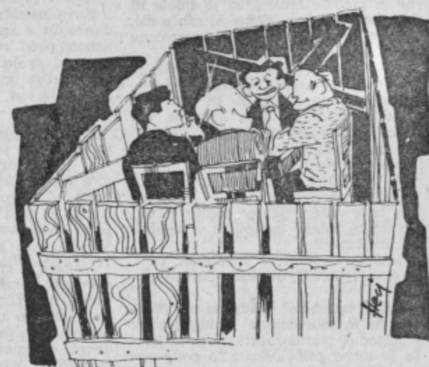
Prizor s svečanega banketa celjskih novinarjev, ki iz »revanže« niso nikogar povabili