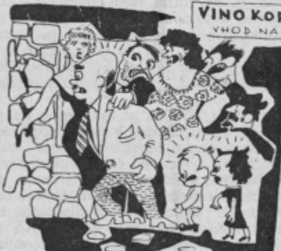
Zakaj tako pestijo tvojega očeta? Zato, ker je rekel, da so celjske godbe kar dobre!