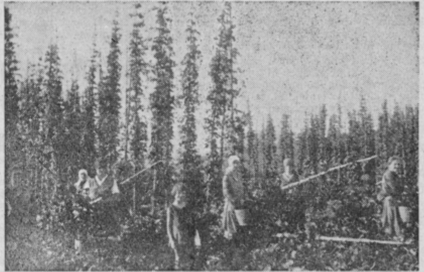
Se nekaj dni in v hmeljiščih bo zaživel...

Nikoli ne pripravljajte več škropiva kot ga potrebujete in uporabljajte samo take škroplilnice, ki delujejo brezhibno.