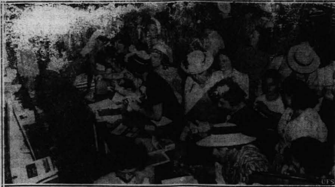
Slika kaže, kako so newyorške žene in dekleta oblegale modne trgovine in kupovale svilene nogavice, ko je prišla vst, da kmalu ne bo dobili več svilenih nogavic v Ameriki.

vinorodnih pokrajin prehaja proti zapadu in severozapadu polagoma v sredogorje, ki je povsod do znatne višine nasečeno z lepimi gozdovi iglavcev in listovcev, pa naj spada to sredogorje k voljnim kristalinskim Centralnim Alpam, kakor Pohorje, znano po svojih planinskih hotelih in domovih, znano po svoji avtomobilski cesti in kot idealno smučišče, ali pa k strmim južnoalpskim Alpam in Dinaridom. Rodovitne in sončne zelene podolžne doline Save in Savinje, Drave in Dravinje s čednimi vasi, trgi in mesti, s samimi priljubljenimi letovišči, kakor so zlasti Mozirje, Nazarje, Gornji grad, Ljubno, Luče in Solčava ob gornji Savinji prepletajo to pogozdno sredogorje ter vabijo v njihova po-deželska letovišča, rečna kopalšča in na izlete v planine, kjer so povsod planinske kočice in domovi urejeni tudi za daljša bivanja i pozimi i poleti. To sredogorje je proti vzhodu ponekod, kakor vzhodje vzhodnega Pohorja, še okrašeno z vinogradi, ki dajejo svetovno znana vina, proti zapadu in severu pa se že dviga v visokogorje ter tvori tako prehod iz ljubke miline nižavja k orjaškim oblikam velegorja.