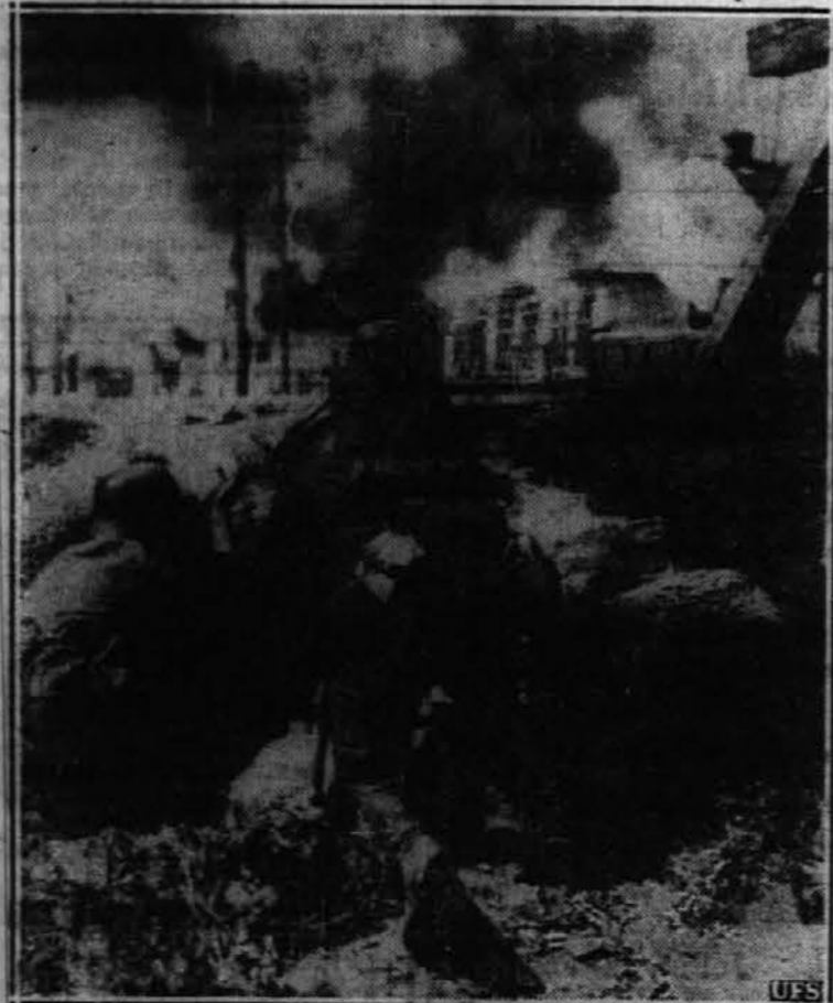
Slika kaže nazijsko stražo ob nekem mostu v boju z Rusi.