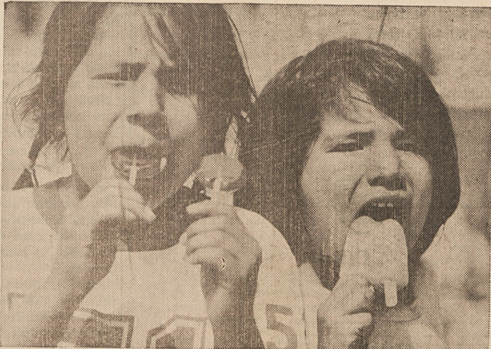
PROTI IZROČILU — Četudi Indijanci niso poznali sladoleda, tema mladima indijanskima deklicama v Sissetonu, S.D., prav dobro tekne.

Derling je izjavil, da je "Vatrostalna" že sedaj sposobna zgraditi tako visoke dimnike.