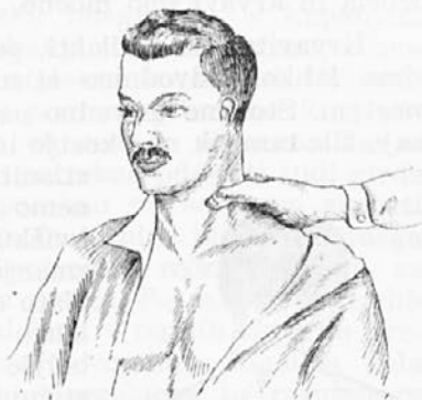
Slika št. 15: Pritisk na glavno vratno odvodnico.

njenec v par minutah. Vratne odvodnice ležijo precej globoko in so težko dostopne. Pritisniti smemo samo eno polovico vratu, ker bi sicer možgani ostali brez sveže krvi. S palcem pritisnemo izpod rane kar se da močno in globoko, kakor to kaže slika (15). S tem skušamo pritisniti žilo ob vratno hrbtenico. Vendar pride v tem slučaju naša prva pomoč skoraj vedno prepozno. Sicer pa se dogajajo take poškodbe razmeroma redko. Če si kdo prereže v samomorilnem namenu