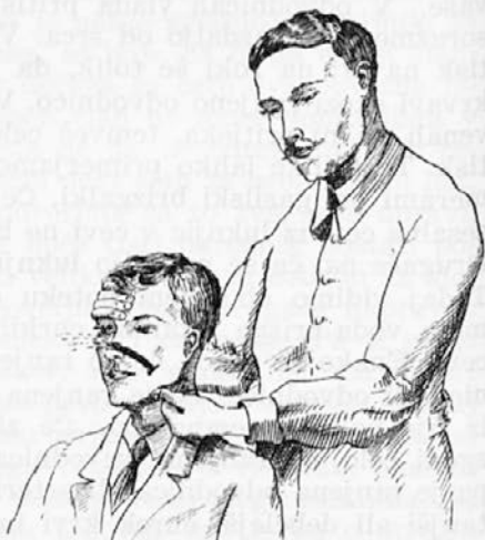
Slika št. 14: Prva pomoč pri krvavitvi iz čeljustne odvodnice.

Izpod spodnje čeljusti se pojavlja na sredini, tik pred žvekalno mišico precej velika arterija. Če krvavi ta, pritisnemo s prstom na spodnji rob spodnje čeljustnice, dokler ne pride zdravniška pomoč. (Slika 14.)