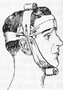
Slika št. 13: Križni zavoj pri krvavitvi iz senčne odvodnice.

v trdo klopko ter isto pričvrstimo s križnim zavojem, katerega čvrsto nategnemo. (Slika 12 in 13.) Umestno je, da damo v klopko kak trdi predmet (kamen, kovan denar), da se pritisk zavoja osredotoči na name-ranem mestu.