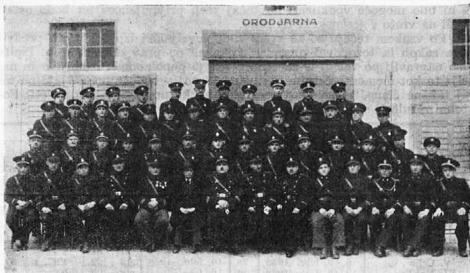
Tečajniki in vodstvo V. gasilskega strokovno-tehničnega tečaja v Mariboru od 26. februarja do 1. marca 1938.

Na tečajih se je predavalo v Ljubljani 47, vadilo 27 ur, v Celju se je predavalo 105 ur, vadilo 58 ur, v Mariboru se je predavalo 174 ur, vadilo 46 ur; skupaj se je predavalo 326 ur in vadilo 131 ur = 457 ur!