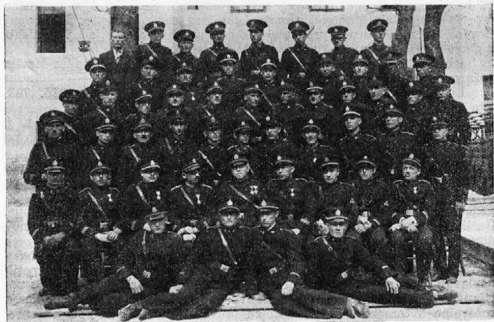
Tečajniki in vodstvo II. gasilskega strokovno-tehničnega tečaja v Ljubljani od 21. do 24. marca 1938.