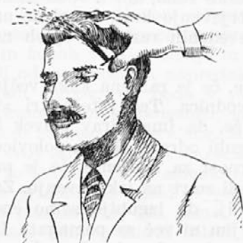
Slika št. 12: Pri krvavitvi iz senčne odvodnice pritisnemo s prstom tik nad lokom lične kosti.

tiskati s prstom tik nad lično kostjo tako močno in tako dolgo, da iz ranjene žile kri več ne brizga. Ker pa s prstom ne moremo izvajati pritiska delj časa, je primernejše, da zavijemo gazo ali robec