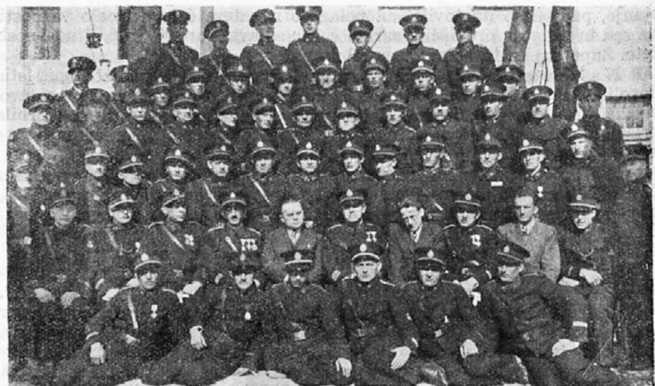
Tečajniki in vodstvo I. gasilskega strokovno-tehničnega tečaja v Ljubljani od 7. do 10. marca 1938.