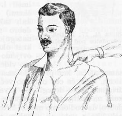
Slika št. 16: Pritisk na odvodnico pod ključnico.

Poskusimo potisniti palec nad ključnico z vso močjo v globino. (Slika 16.) S tem pritisnemo odvodnico na prvo rebro. Priporoča se tudi, da potegnemo nadleht na ranjeni strani kar se da