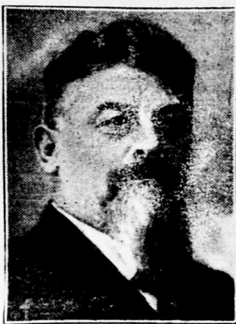
Ljubljana, 19. februarja.

Kot velikega pisatelja ga znamo ceniti tudi dandanes — Njegova dela še vedno zelo čitamo