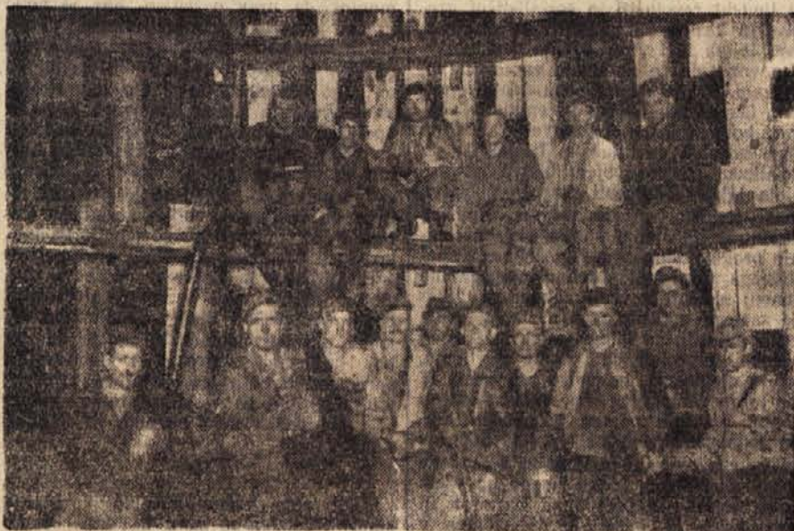
Brigada, ki pogleda novi jasek pri rudniku lignita Velenje

Kolektiv ekupno z vodstvom rešuje uspešno tudi vprašanje strokovnih kadrov. Organiziranih je več tečajev, v ka-