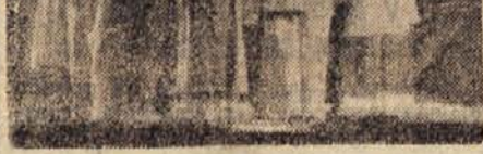
Železničarski kolektiv pri otvoritvi sindikalnega odra na postaji v Ljubljani. V skupinah nudil dovolj prostora za njihovo uspešno udeleževanje.

Ljubljanski železničarji so zgradili svoj dom - Železničarji postaje Ljubljana in ostalih železniških črt v Ljubljani so si z lastnim delom in z veliko ljubiteljsko gradnjo svoj »Dom kulture«, ki bo vsem našim dramatikom, rodbinam, folklor-