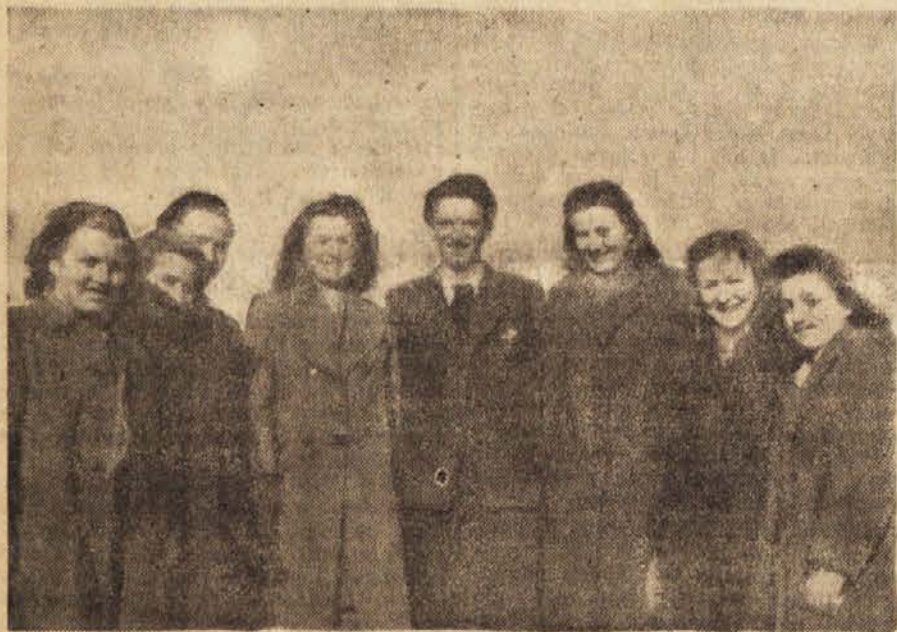
Brigada »Slavko Rabuza«