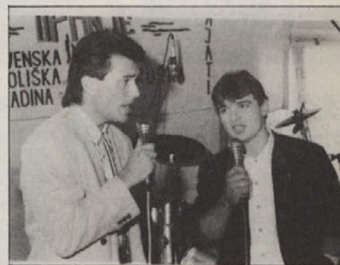
Številni mladinci na mladinskem dnevu.