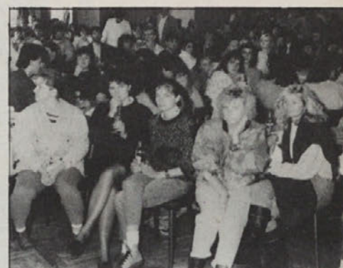
Pogumna Šmarječana sta zapela.