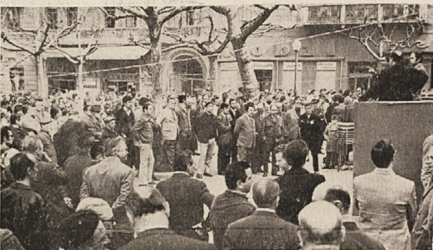
Delavski shod na Garibaldijevem trgu na dan splošne stavke.

Senator Paolo Sema je naslovil ministru za obrambo in ministru za prireditve nujno vprašanje v zvezi s prireditvijo društva »Ginnastica Triestina«.