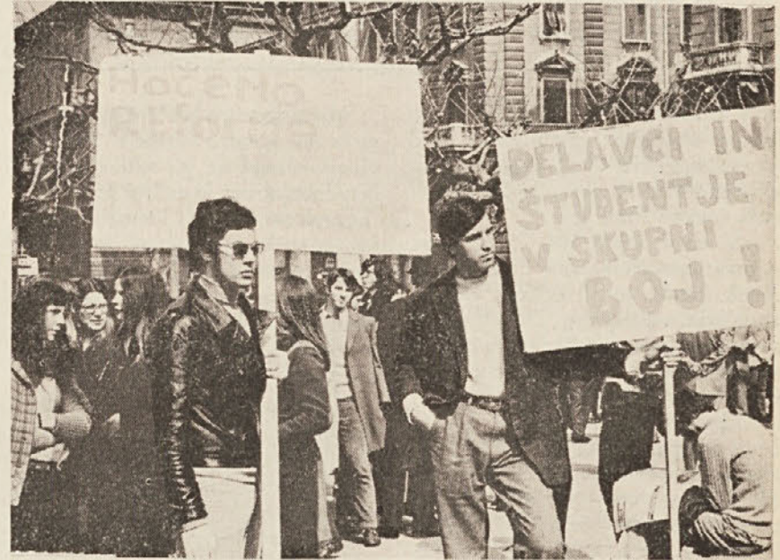
Slovenski študentje na delavskem shodu na dan splošne stavke. Sindikat slovenske šole se ni pridružil stavki

Mnogi se sprašujejo, kakšen pomen je imela splošna stavka, ki so jo enotno oklicale tri vsedržavne sindikalne organizacije. Odgovorov je lahko veliko, vendar velja predvsem poudariti, da lahko razumemo njen pomen, tudi če pazljivo sledimo in obnovimo stališča tistih, ki so se izrekli proti njej.