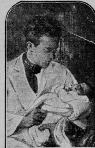
Belgijki prestolonaslednik pestuje svojo hčerko princeso Joséphine-Charlotta. Posnetek je napravila njegova mati kraljica Elizabeta belgijska.

se podpisuje v zlato knjigo letalstva. — Na njeni levici Georges Haldeman.