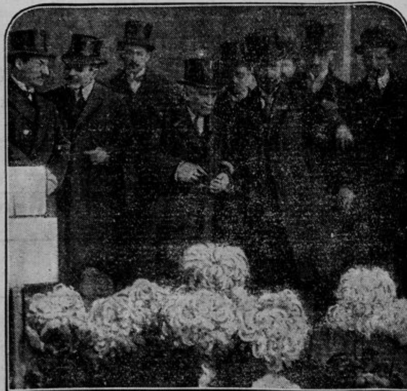
Vrtnarska razstava v Parizu