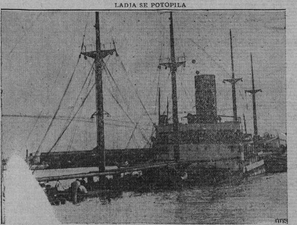
Tovorna ladja Edgar F. Luckenbach iz New Yorka, ko se je nedavno potapljala v pristanišču v New Orleansu po neki koliziji. Vsa njena posadka pa se je k sreči pravočasno rešila brez nezdod.

"Amerikanski Slovenec" in "Novi Svet" sta lista, brez katerih bi ne smela biti nobena slovenska družina!