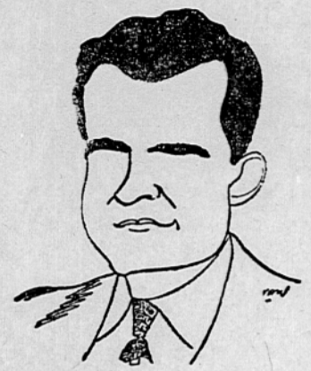
Podpredsednik ZDA Richard M. Nixon

Washington, 7. jan. (USIS). Ameriški 83. kongres je na svojem prvem zasedanju formalno razglasil generala Dwighta Eisenhowerja za bodočega predsednika ZDA. Bodoči predsednik ZDA Eisenhower in bodoči podpredsednik ZDA Nixon sta dobila od skupnih 531 glasov 442 glasov. Novemu predsedniku ZDA bodo slovesno izročili državne posle 20. januarja.