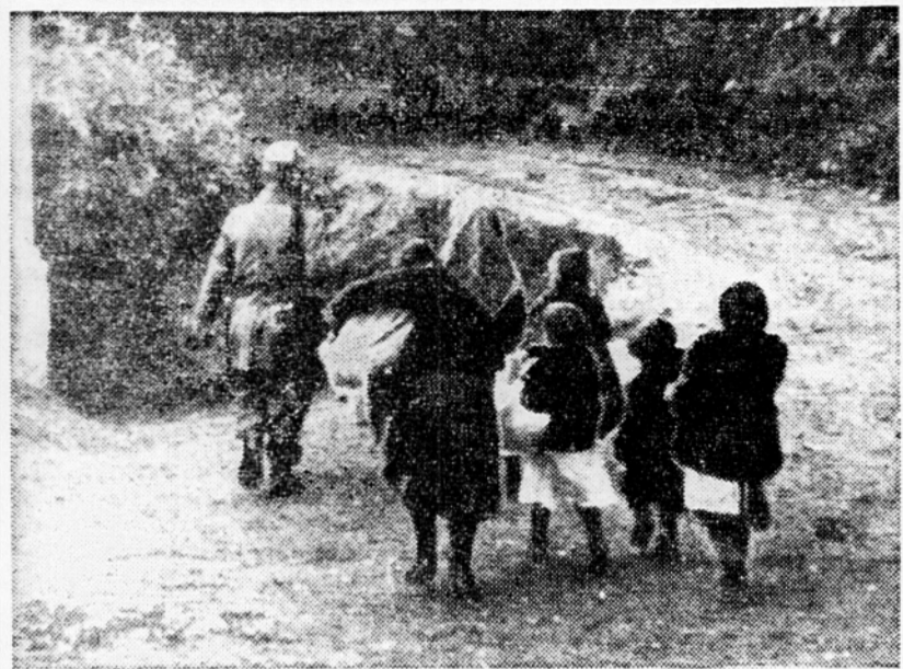
Priznavašali niso niti otrokom, ki so morali skupno s svojimi starši v nacistično suženjstvo. Žrtve so izbirali koroški Nemci in je zato predvsem Avstrija odgovorna za vse žrtve in trpljenje koroških Slovencev

Danes obhajajo koroški Slovenci spomin na najhujši zločin nemškega nacističnega nasilja, na množično izselitev Slovencev na Koroškem. Ta peklenska akcija, preračunana na popolno iztrebljenje koroških Slovencev, ni podobna uničenju čeških Lidic in drugim sličnim zločinom nacističnih tolp, ki jih je rodilo trenutno pobesnelo divjanje nacističnih množic, marveč gre v tem primeru za hladno, krvno, skrbno preračunano in pripravljeno uničenje pomembnega dela slovenskega naroda. Po svoji zasnovi, po izvedbi in cilju je še najbolj podobno ideološko in programsko zločinu uničenju židov ter sistematičnemu uničenju Poljakov. Niti danes, ko sta potekli od zločina nacističnega gospostva na Koroškem že dve leti, še ni bilo mogoče dobiti celotne slike obsega, grozovitosti, materialne škode in žrtev tega zločina. Vidno pa je postalo doslej skrbno prikrivano ozadje, krivci in povzročitelji tega edinstvenega nemškega nasilja nad malim slovenskim narodom v osrčju Evrope.