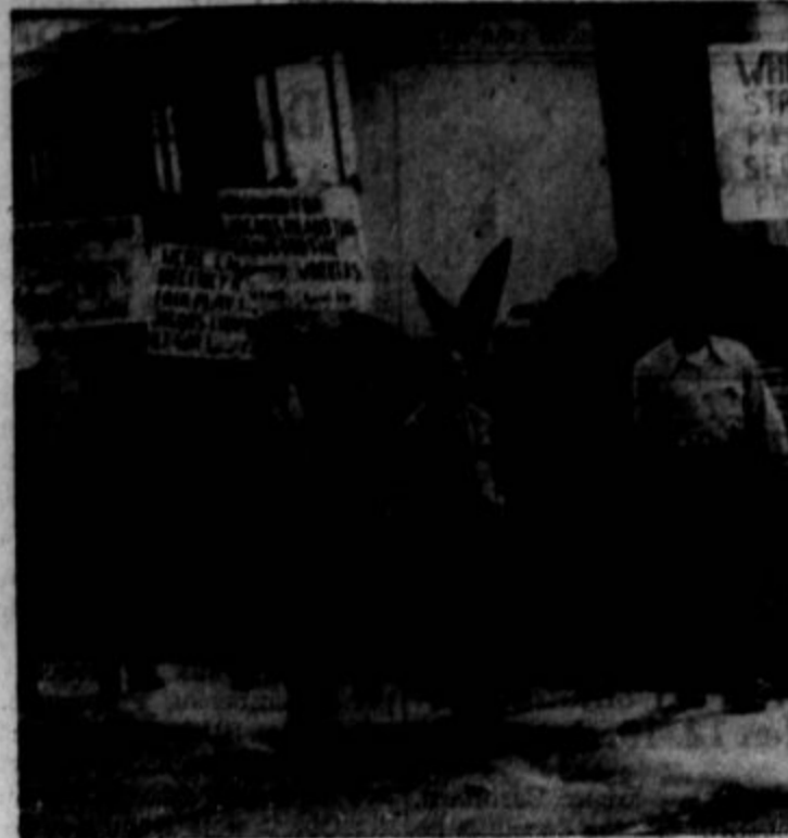
Član! unije mizararjih delavcev CIO v Los Angelesu nesejo krsto za Taft-Hartleyev zakon v piketni liniji, ker je lastnik Baby Line Furniture Co. odklonil pogajanja za novo pogodbo.