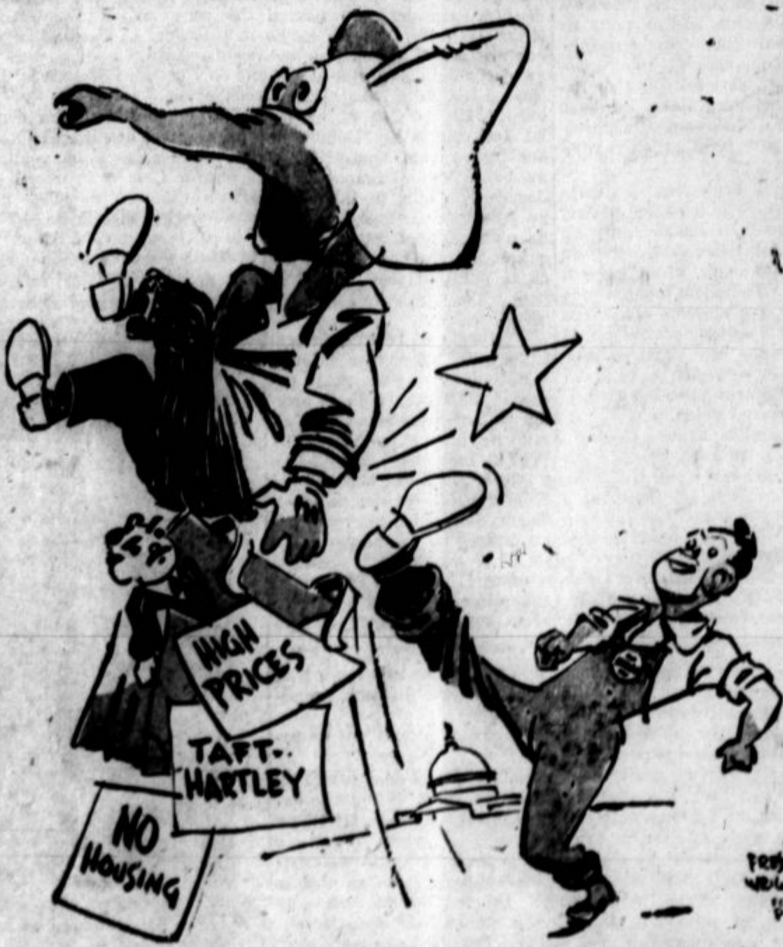
Tako se je zgodilo na volilni dan s slonom, ker je prodajal smrdljivo robô.

Doznava se, da Bramuglia upa, da bo pridobil obe strani za svoj najnovejši predlog do torika, 30. nov., ko poteče njegov mesečni termin kot predsednik Varnostnega sveta.