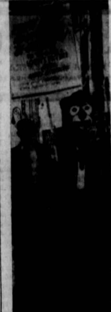
Ko so člani unije pisarničkih in profesionalnih delavcev CIO zahtevali od filmskih magnatov, naj se pogajajo glede plače, se niso zmenili za pogajanja, spgnili pa so se potem, ko se je izkazalo, da so apeli piketov na obištnstvo snili dohodke pri gledališčni blagajni v New Yorku.

Alli ste naročili na dnevnik "Prosveto"? Podpisajte sebi list!