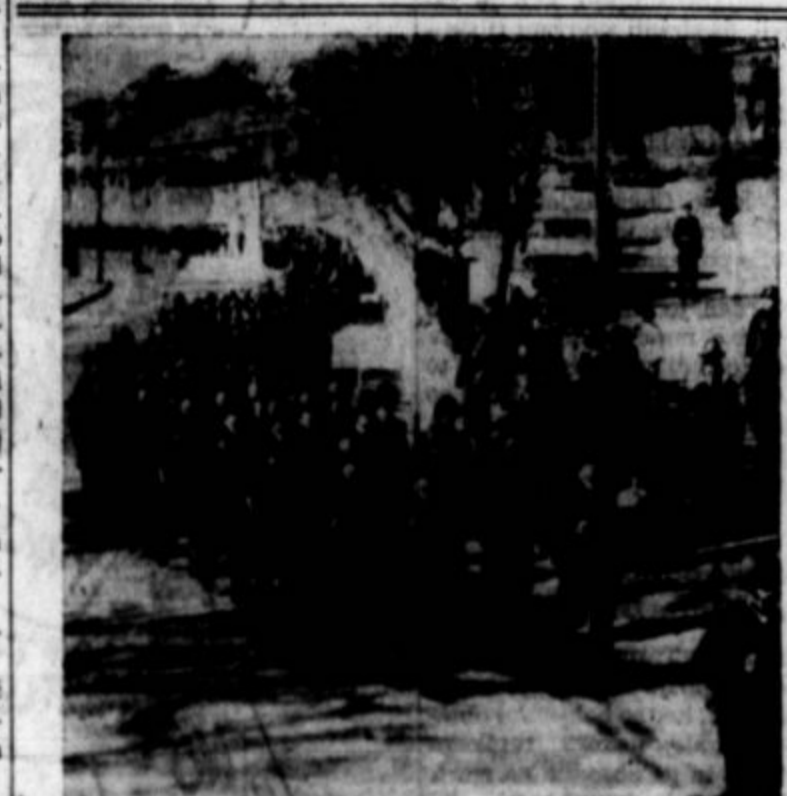
Ceta ameriških vojakov-pomorščakov koraka po ulicah mesta Cingtao na Kitajskem, kamor so bili poslani, da pomagajo pri izselitvi 4.000 ameriških civilistov po sijajnih zmagah komunističnih ljudskih sil, ki so porazile armade diktatorja Kajška pri Sučovu.

Teta, ako bi vi govorili z našimi delavci, oni bi vam znali povedati, kako je danes v naši novi Jugoslaviji. Tisti, ki so se javili po radiu, so bili v taborišču. Marsikateri bi se rad vrnil, ali se noče ponižati. Nekateri pa so se že vrnili.