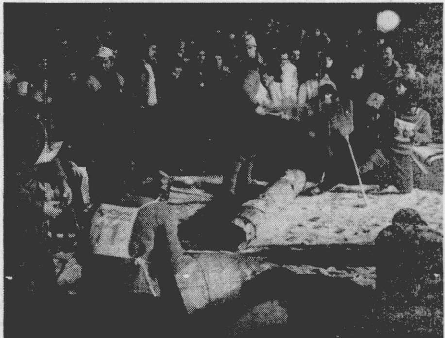
Prizor iz prvih zimskih iger Dela in Kompassa v Bovcu.

po kočah na novoletni dan. Vsega se ne da prinesiti na rokah, zato so potrebne tudi sanke. Če so le-te precej polne, je vse težje. Tudi s tem se bodo »zabavali« tekmovalci štirih ekip. Da pa tekmovanje le ne bi bilo prelahko, bodo tekmovalci tudi smučali. Pa ne navzdol, ampak navzgor. Ob tem bodo nalleteli še na ovire. Sicer pa vsega ne nameravamo niti povedati. Pridite v soboto na Veliko planino, ob 12. se bodo igre za Šimnovcem začele, pa boste videli. Smeha prav gotovo ne bo manjkalo. Na sliki pa je prizor s prvih iger, ki so bile preteklo soboto v Bovcu. (V. A.)