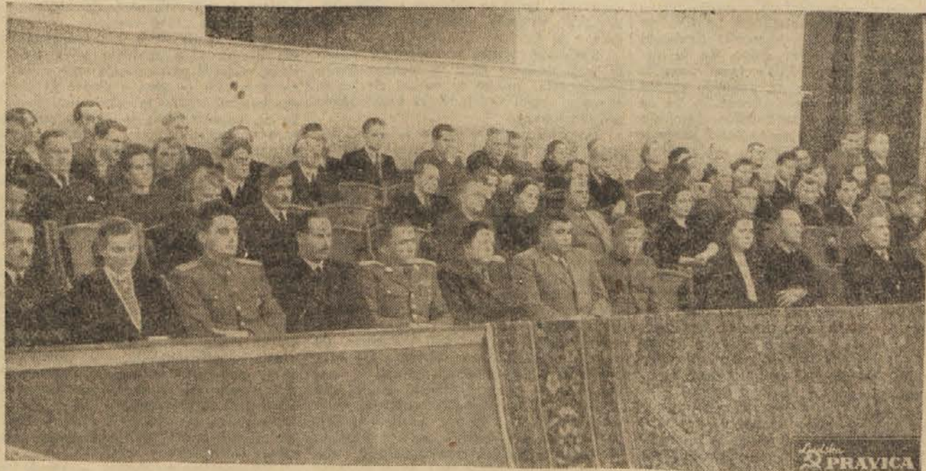
S proslave 30 letnice Oktobrske revolucije v unionski dvorani v Ljubljani: Člani CK KPS, IOOF, vlade LRS, JA in gostje med proslavo.