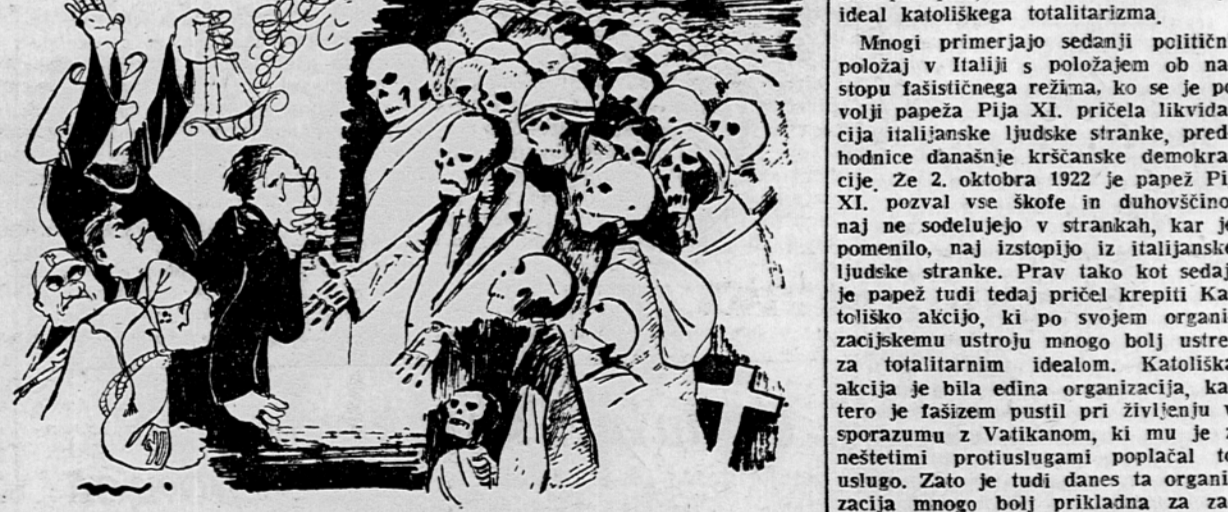
... Gospod predsednik, kako boste pa nas rehabilitirali?

vzhod ne na zahod, čeprav po mednarodnih gospodarskih zvezah danes gotovo spadamo v sklop zahodnih držav, ker z vzhodnimi zaradi gospodarske blokade tako nimamo nobenih stikov. Bolj je čudno, da ima Pregled za našo državo tako borne podatke.