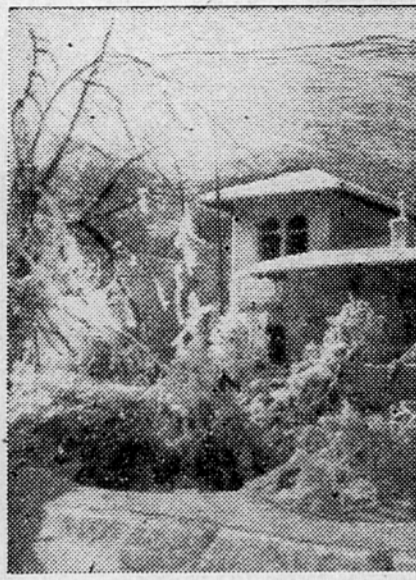
Sedež kraljevnega ljudskega odbora v Grgarju med zmrzaljo

sovac, Macenovce, pa tudi Brezov hrib in Jurc. Slap Rinka je okovan v ogromen ledeni zvon (kakih 20 m visok), s prepada pa visi 30 m visoka ledena zavesa. Trd boj s snegom bi jejo drvarji iz Matkovega kota (Covniki, Gradski, Matkovi, Kocnarjevi, Sumeč in Zibovci). Zivljenje terja svoje, posekan les mora iti naprej. Do vseh posestnikov pri Sv. Duhu drže steze, tudi do Ložkarja, s katerim niso imeli zveze en mesec. Prav tako je prehojena gaz tudi do vseh olševskih kmetij, tudi do Bukovnika, najvišjega posestnika (1200 m) v tem kotu, pod Raduho. V Robanovem kotu pravijo, da so takega snega navajeni. Spominjajo se zime leta 1908-9, ko je zdrvel s Knezove ruče in Molznika orjaški plaz do Travnika v dno doline. V enem samem rokavu so izsekali tedaj 800 kub. metrov drv iz polomljenega drevja. Tedaj so pla-