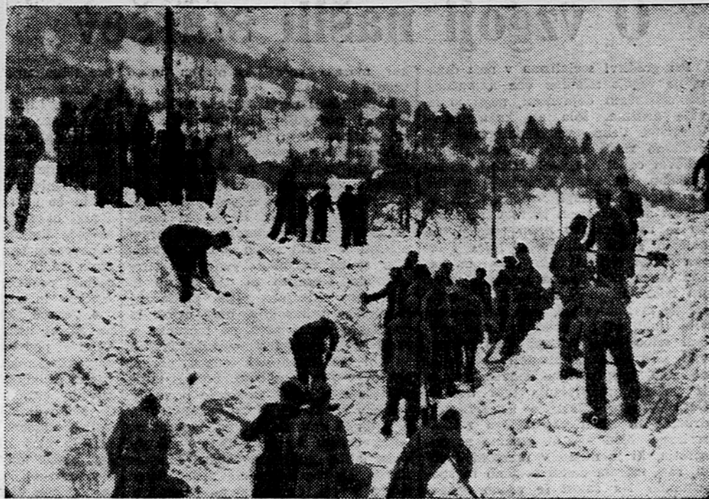
Borci JLA pomagajo prebitati velik plaz, ki se je vsul na cesto med Tolminom in Kobaridom pod vasjo Kamen.

Da bo mogla nova zadruga finančno bolje poslovati, so zadrugniki sklenili povišati deleže, ki so doslej znašali po 150 din, na 1000 dinarjev. Zadrugniki so hkrati privolili, da sme upravni odbor najeti do dva in pol milijona kredita za obratovanje.