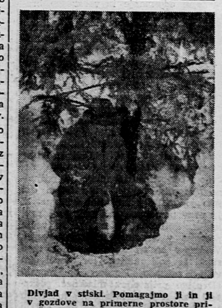
Divjad v stiski. Pomagajmo ji in ji v gozdove na primerne prostore prinašajmo hrano. — Na sliki: dober lovec ni pozabil na divjad v stiski.

V zadnjih dneh se je sneg že močno usedel in je čas, da vso zdravo divjad, predvsem srnjad izpustimo iz ograj, šup, ali kjer koli smo jo že varovali in ji prinašajmo hrano v gozd ali vsaj v bližino. Na noben način pa ne zadržujmo divjadi, da ne bo škoda še večja. Lovci naj poskrbe, da bo divjad imela mir. Zato pa je treba pse prikleniti na verige ali pa jih vsaj drugače nadzorovati, da ne bodo preganjali divjadi ali jo celo unicavali. Naša množična skrb naj bo taka, da prinašajmo hrano divjadi tako, da je ne bomo podili in utrujali. Škoda doslej je velika in storimo vse, da ne bo še večja!