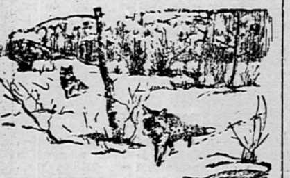
Lisica na sledi za ranjeno srno

Na Goriškem se je divjačina umaknila pred hudo zimo na sončne obronke Vipavske in v Furlanijo. Petindvaj-