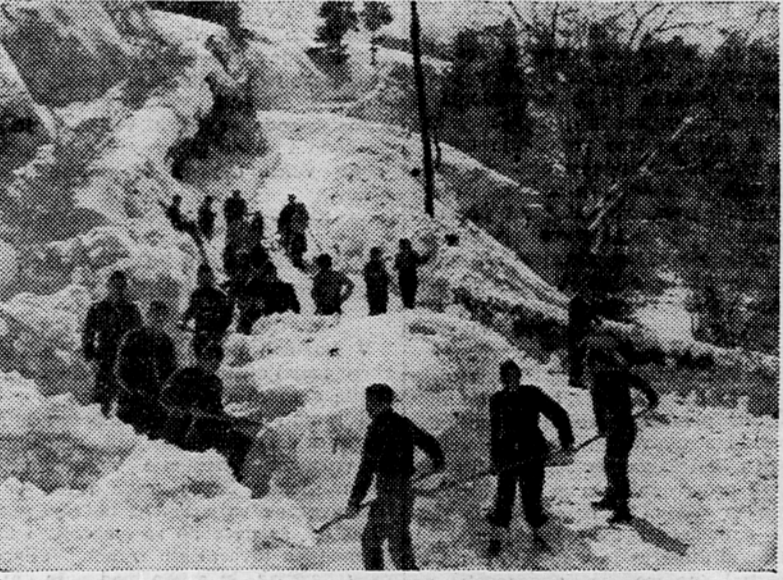
Pripadniki Ljudske milice čistijo cesto med Tolminom in Kobaridom