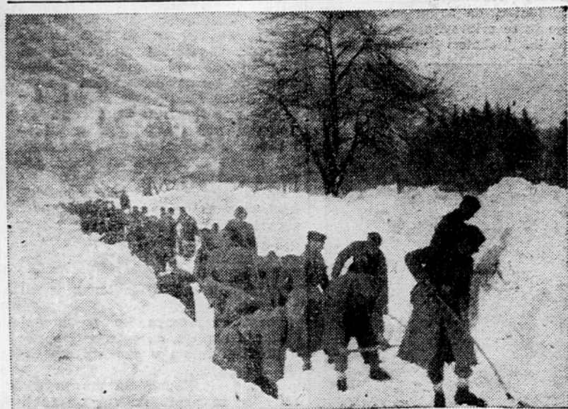
Naši vojaki prebitajo cesto med Tolminom in Kobaridom