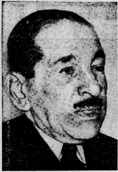
Predsednik egiptovske vlade Ali Maher paša

Predlogi so sestavljeni sporazumno s predstavniki vseh političnih strank v Egiptu in Sudanu