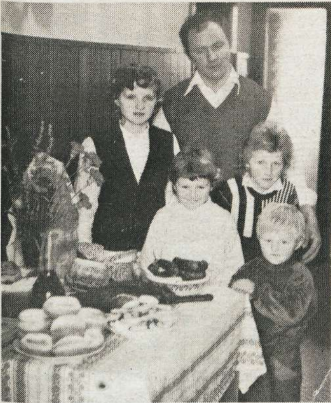
Kar nekaj domačih specialitet je bilo na mizah ob otvoritvi (potica, krofi, klobase, šunka, vino, drobno pecivo itd.). Tudi svoje tri otroke sta pritegnila k fotografiranju, saj v prihodnosti računata tudi nanje. (Foto: DRAGAN MEJAC).