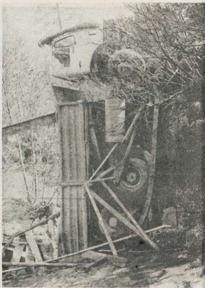
ostalo je že šlo, za ognjeno vodo...«

— Prevzeli so ga miličniki. — »Bele miške, majcene, so edina stvar, ki imam jo še, vse