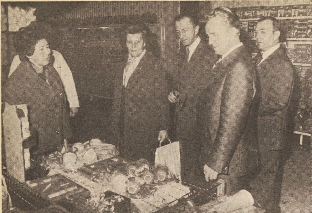
Madžarski gostje iz Železne županije v E-centru v Kosezah