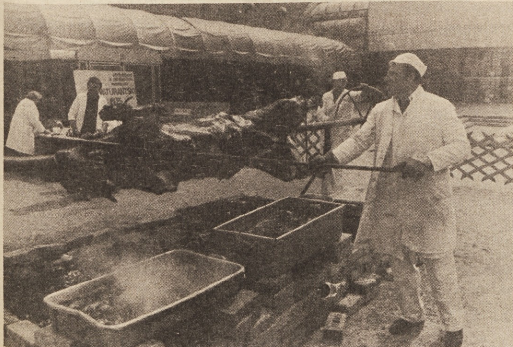
Prvi mojster iz MIZ, strokovnjak za peko vola na ražnju, v Domžalah

Seznam jubilatov DO Agroemona objavljamo posebej.