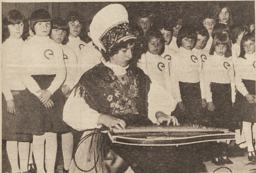
Mešani pionirski pevski zbor iz Ihana in dekle, ki igra na citre

nje leto — tako smo ga prav zdaj do leta 1982. DO Agroemona ima za naslednje petletno obdobje v načrtu naložbe v vrednosti 100 S milijard dinarjev, kar je samo po sebi dovolj zgovorno. Gre za eno četrtino vseh vlaganj, ki jih načrtuje celotna SOZD Emone in nedvomno za močno ekspanzijo pri modernem pridelovanju hrane, ki sodi pod prioritete jugoslovanske gospodarske usmeritve v naslednjem obdobju.