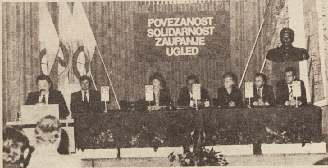
Delovno predsedstvo na proslavi Agroemone v Domžalah

pa zato ena najpomembnejših organizacij v sistemu Emone. Pred njo so namreč obsežni razvojni načrti, ki ne segajo samo pet let naprej — saj vsako leto načrte podaljšujemo za nadalj-