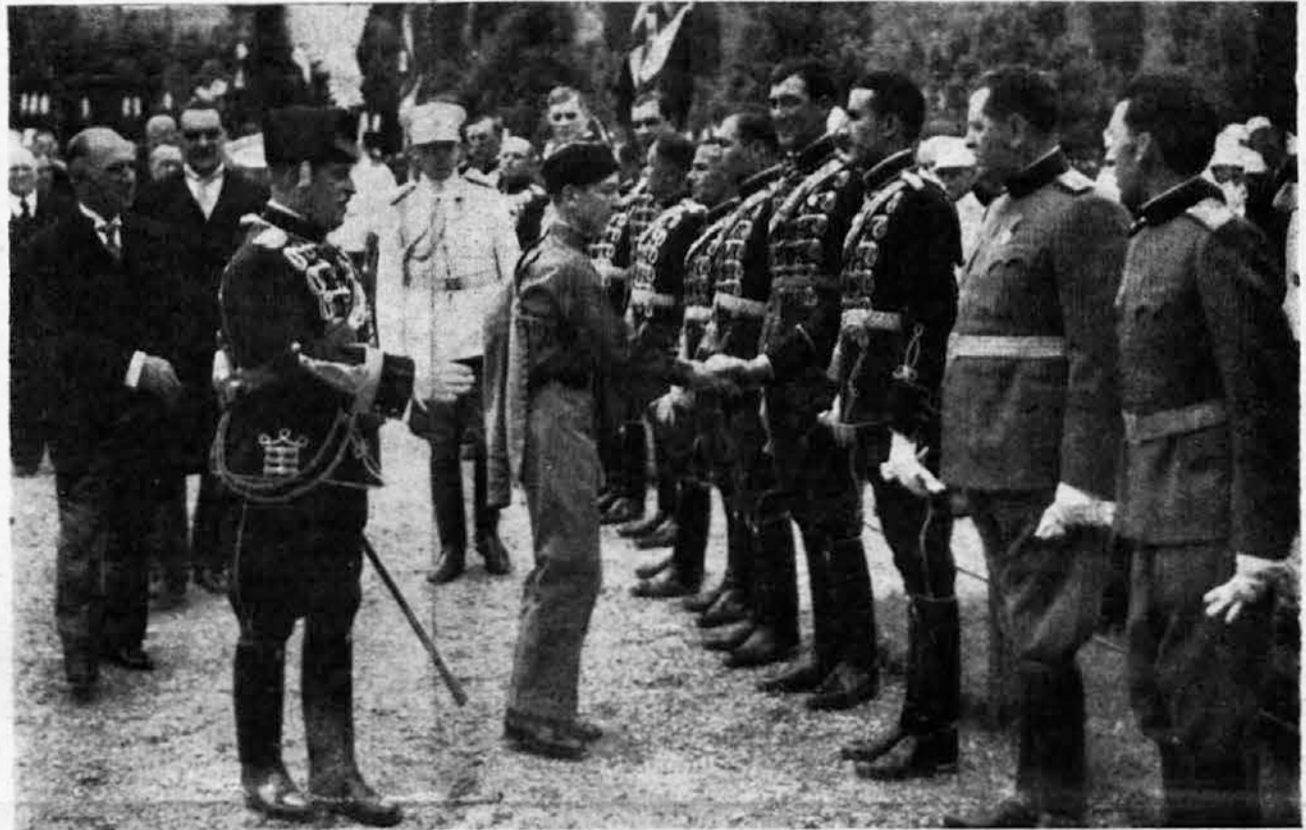
Nj. Vel. Kralj Petar II po dolasku na slavu pozdravlja se s oficirima Kraljeve garde

na slavi Konjičke brigade Kraljeve garde 25 o. m.