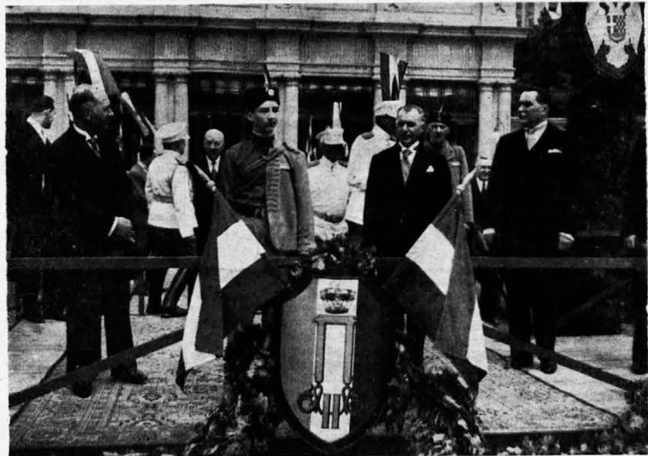
Nj. Vel. Kralj Petar II s Kraljevskim namesnicima g. g. dr. R. Stankovićem i dr. I. Perovićem te s predsednikom Kr. vlade dr. M. Stojadinovićem i ostalom pratnjom posmatra defile Kraljeve garde