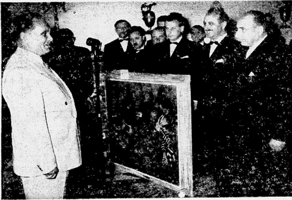
Člani delavsko-prosvetnega društva Svoboda-Slava Klavora iz Maribora čestitajo predsedniku Titu za njegov rojstni dan