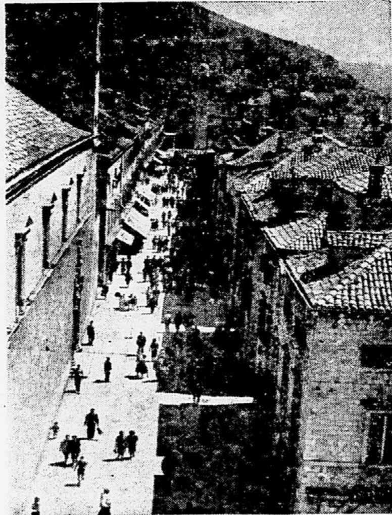
Dubrovnik malo drugače kot ponavadi

»Niti najmanj ne dvomim, da je preteklost obtoženega Jamesa Morlake zločinska. Še manj dvomim o tem, da je prav on zločinec, ki uživa zavidijske sloves kot Črnuh. Ali niti najmanj ne dvomim o njegovi nedolžnosti v obtožnici, naperjeni proti njemu pred tem sodnim zborom. Izjave policije niso bile zadovoljive. Ne verjamem, da sta Marborne in Slone, ki sta nastopila kot glavna svedoka, govorila čisto resnico. Navedla sta vse mogoče dokaze, ki me pa niso mogli prepričati. Z drugimi besedami: menja sem, da sta vsa zadevo izmenoma pripravila, da bi prevarila sodni zbor in dokazala obtoženo krivdo. Zato predlagam porotnikom, da se odločijo za razsodbo »nedolžen«. Pristavljam pa — pri teh besedah se je obrnil naravnost k obtoženo — »da bom pred drugim sodnim zborom, ki mu bom sam predsedoval, Jamesa Lexingtona Morlake