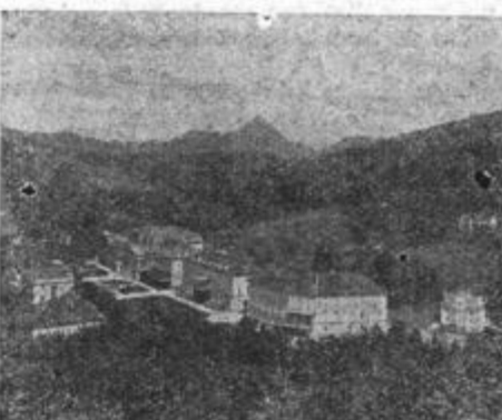
Zdravilišče Rogaska Slatina

Mnogo so razpravljali tudi v novi uredbi o gostinskih obratih. Ker je v okraju okrog 35% zasebnih gostinskih obratov, v katerih je večkrat potrebna boljša in kulturnejša kot v nekaterih socialističnih obratih, so prišli do zaključka, da bodo zasebna gostišča še nadalje koristila potrebam na terenu. Morala bodo le vskladiti svoje poslovanje s predpisi nove uredbe (topla je-