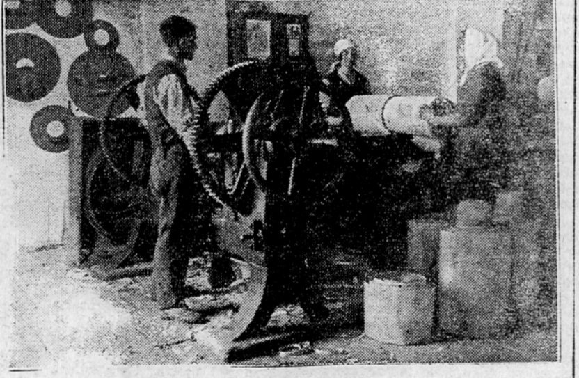
Domača obrt v Ribniški dolini: sitarji

Vse to najbolj potrjuje dejstvo, da je danes po večini Črnogorskih srezov odprtih več šol kot pred vojno. To je plod skupnega prizadevanja oblasti, ljudstva, mladine, ki kaže izredno