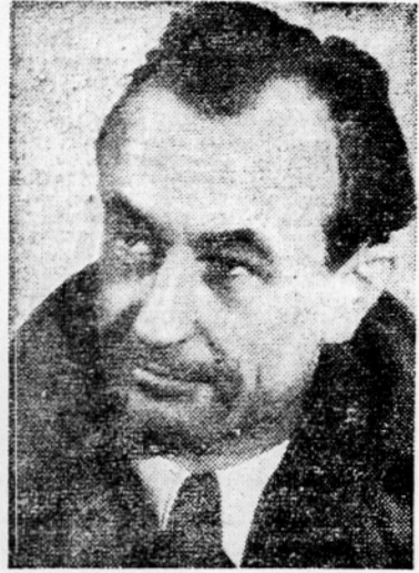
Pisatelj Cyril Kosmač

I. Revolucionarne spremembe v naši državi so izročile tudi vsa kulturna bogastva v roke ljudstva. Slovenski narod, ki je bil vse do osvobodilne vojne brez lastne filmske proizvodnje, je dobil po zmagi tudi svoj film. Dejstvo, o katerem bi v stari Jugoslaviji komaj mogli sanjati, nam tako potrjuje resničnost in tehotnost zakonov dialektike, ki trde, da je v kulturi — prav tako kot na drugih področjih življenja — mogoče priti do nečesa novega samo po revoluciji, po globoki preobrazbi. Vsaka resnična kultura je v določenem zgodovinskem okviru revolucionarna. Zgledov za to nam v slovenski zgodovini ne primanjkuje. Najnovejši dokaz za to nam je rojstvo slovenskega filmskega filma. Dan njegovega prvega predvajanja — 21. november 1948 — bo zato ostal kot prelomni datum v zgodovini slovenske kulture.