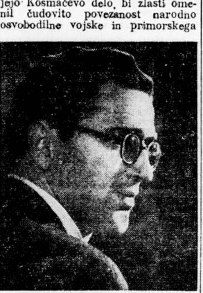
Režiser France Stiglic