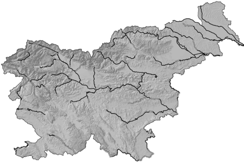
Slika 1: Popisni odseki januarskega štetja vodnih ptic (IWC) na rekah in obalnem morju v Sloveniji leta 2017; črne črte označujejo popisane, bele pa nepopisane odseke.