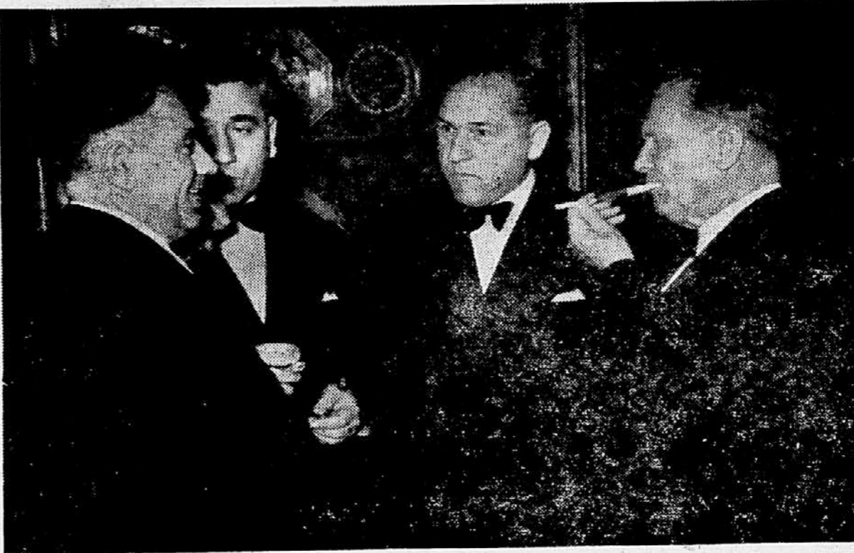
S sprejema v zveznem izvršnem svetu na Dan republike. — Na sliki: predsednik republike Josip Broz - Tito v razgovoru z Ivanom Gošnjakom, Aleksandrom Rankovićem in Jovanom Veselinovim.