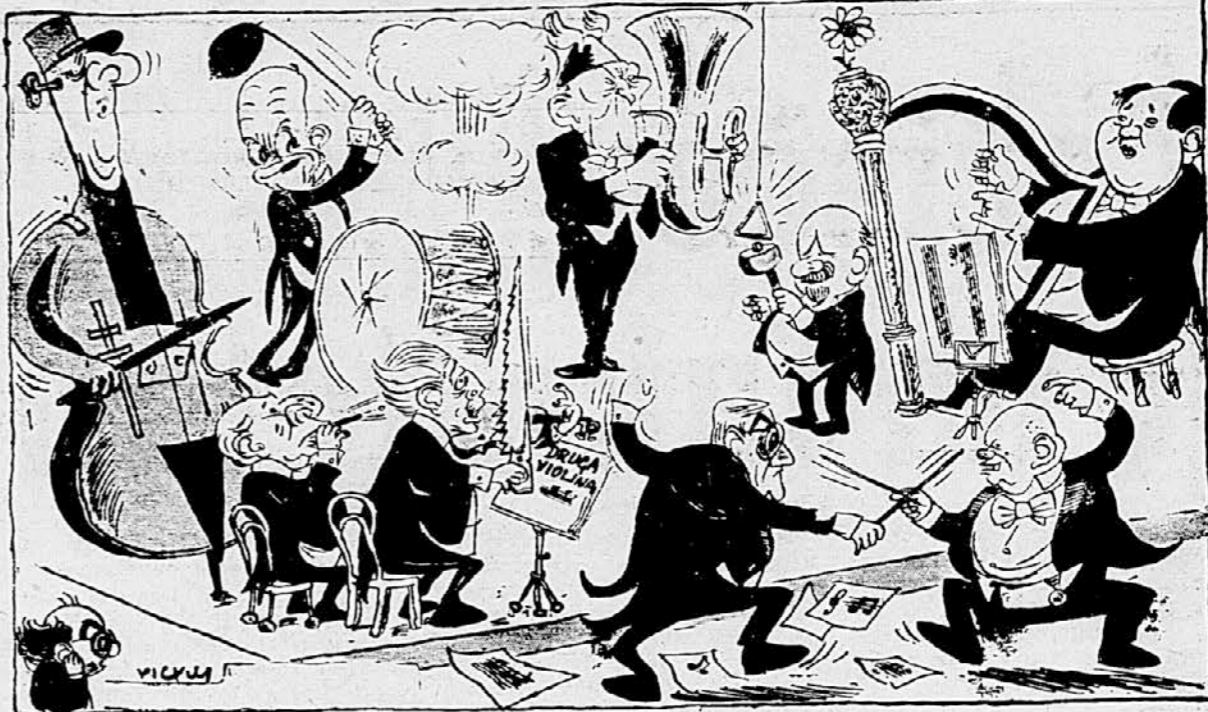
ALI SE VAM NE ZDI, DA IGRA PRESEGA ZE VSE MEJE?*

Sovjetske predloge podpirata tudi madžarska in kitajska vlada. Z druge strani pa je ameriški zunanji minister John Foster Dulles po sestanku s predsednikom Eisenhowerjem v nedeljo v Augusti, kjer je predsednik na odmoru, izjavil novinarjem, da je Eisenhower odločen proti kakršni koli ureditvi, ki bi pomenila opustitev odgovornosti ZDA za vzdrževanje sedanjega statusa svobodnega prometa in varnosti prebivalstva v Zahodnem Berlinu.