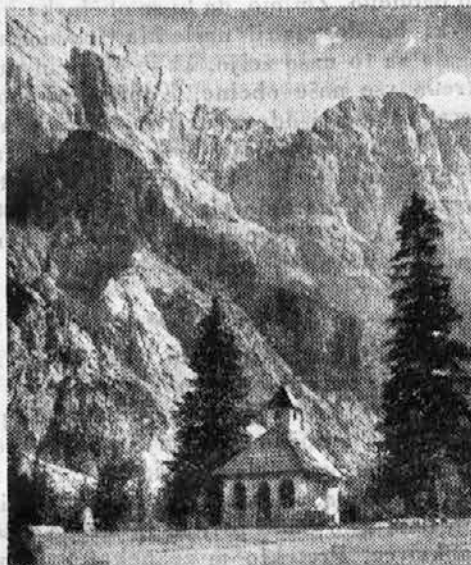
PLANICA — NOVA KAPELA

Ena najhujših boleznih, ki je pomorila naenkrat največ ljudi, je bila »španska«, katere se še vsi spominjamo iz dobe po prvi svetovni vojni. Ta mrzlica z influenco je v letih 1918-1919 pobrala po vsem svetu preko 21 milijonov ljudi.