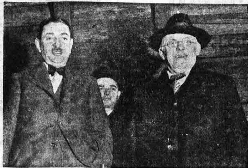
Slika, ki naj bi pomenila napoved za lepšo bodočnost: Predsednik vlade Dragiša Cvetković, ki je v nedeljo dopotoval v Zagreb na posvetovanja glede sporazuma z dr. Mačkom, in hrvatski voditelj dr. Maček, slikana pred vilo na Rebri, kjer stane predsednik vlade med svojim zagrebškim obiskom.

Dr. Maček izjavlja, da se je delo dobro začelo