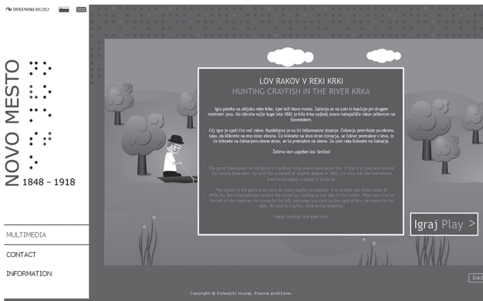
Slika 6: Začetna stran spletne igre Lov rakov v reki Krki

o nekaterih objektih, ki so bili ob reki (leseno kopalnišče, star most, jez in mlin). Tematika lova rakov je bila izbrana zato, ker je bila reka Krka s pritoki do izbruha račje kuge največje lovišče rakov jelševcev na Slovenskem, saj so jih po nekaterih podatkih nabrali do 100.000 na leto in jih dobavljali v vsa večja mesta tedanjega Avstrijskega cesarstva.