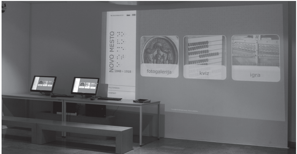
Slika 2: Projekcija digitalnih vsebin v prostorih klasične razstave