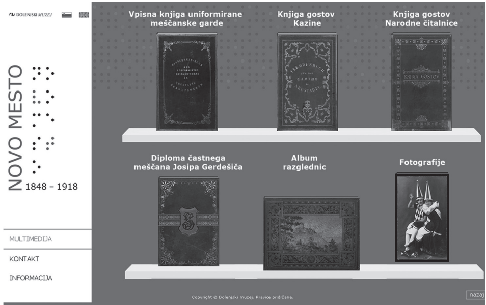
Slika 1: Digitalizirano gradivo, dostopno na spletni strani razstave