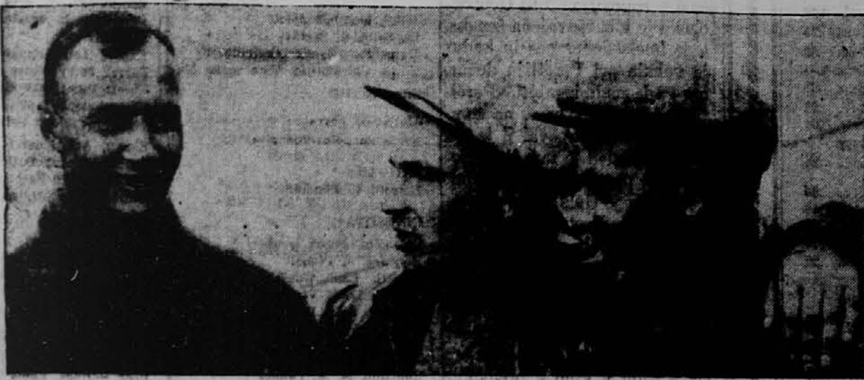
Gornja slika nam kaže sovjetsko letalo, ki je poletelo iz Moskve preko severnega tečaja v Vancouver v državi Washington. Razdalja znaša nad pet pet tisoč milj. Na spodnji sliki so sovjetski letalci: Aleksander Beljakov, Valerij Čkalov in Georgij Bajdukov. — Sliki sta bili posneta v Vancouverju v državi Washington.