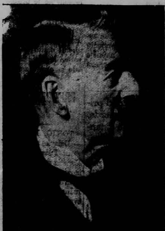
angleški ministrski predsednik, ki priznava nevarnost nove evropske vojne.