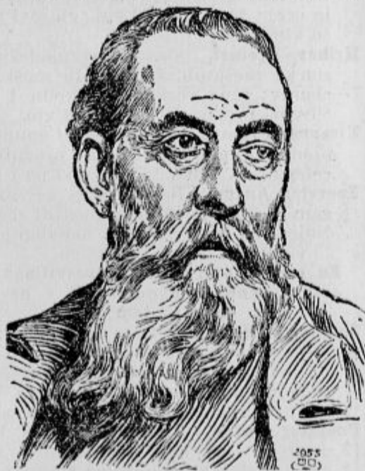
PROFESOR REINHOLD BEGAS.

— Duhovne vaje za gg. učiteljice. Predstojništvo uršulinskega samostana v Ljubljani ustreza tudi letos želji gg. učiteljic, ki bi se rade udeležile duhovnih vaj. Te se bodo obhajale letos od 3. do 7. septembra. Gg. učiteljice, ki želijo se udeležiti, so prošene, da se oglasijo ustno ali pismeno do 1. septembra.